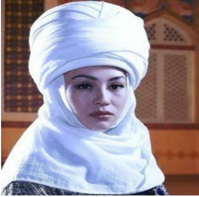
3. Eleçekli bayan