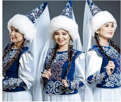
6. İki örüm saçı ve şökülölü (evlenecek) kız

http://vzglyadriv.kg/sdelay-sam/7802-kyrgyzdyn-uluttuk-bash-kiyimderi.html