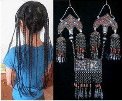
5. Beş kökül kız ve çaçpak