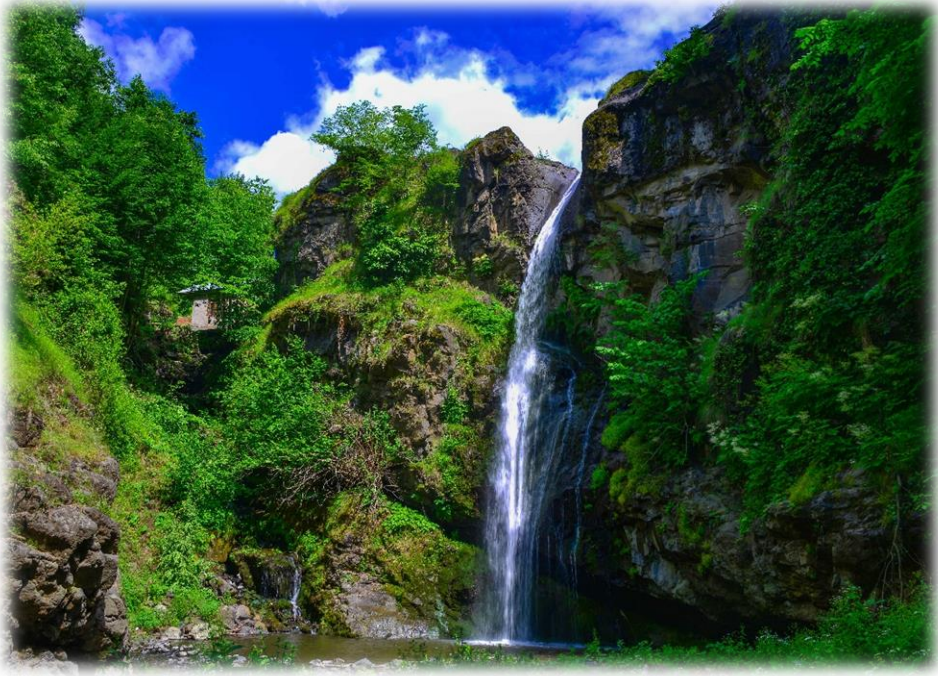
Resim 7: G?rge?nliyatak Őelalesi

G?rge?nliyatak Őelalesi ilçe merkezine 45 km uzaklıkta (Ordu B?y?kŐehir Belediyesi, 2021) olup, Samsun-Ordu yeŐil yol g?zergahından yaklaşık 10 km uzaklıktadır. Ayrıca Őelalelin olduđu yerde y?re halkının kullandığı bir su deđirmeni bulunmaktadır. Őelalede suyun d?Őt?đ? alanın y?ksekligi yaklaşık 25 metredir. Őelaleye giden yol ise araç safari iin oldukça uygundur. Ayrıca Őelalenin d?Őt?đ? alana ulaŐmak iin patika yol mevcut deđildir. Ormanlık arazi ?zerinden ulaŐmak m?mk?nd?r.