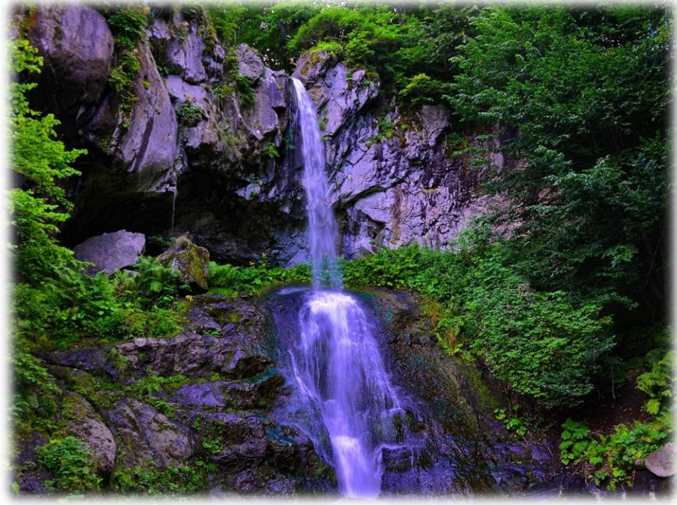
Resim 5: Kurtboğaz Şelalesi

Çaldere şelalesi merkeze 5 km uzaklıkta Çaldere mahallesinde (Ordu Büyükşehir Belediyesi, 2021) yer almaktadır. Şelale Akkuş merkezden Salman Beldesine ilerleyen yol üzerinden konumlanmaktadır. Ayrıca yöre halkı tarafından piknik ve doğa yürüyüşleri bağlamında kullanılmaktadır. Turizm bağlamında herhangi bir alt ve üst yapı çalışması yapılmamıştır. Ayrıca şelaleye ulaşım için yol kenarından yaklaşık 500 metre patika yol üzerinden ilerlemek gerekmektedir. Debisi özellikle ilkbahar ve sonbahar mevsimlerinde yüksek olmaktadır.