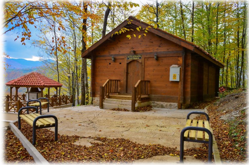
Resim 11: Melikgazi Türbesi

keşiftir. Bu sebeple tarihi hakkında yeterince bilgi mevcut değildir. Ayrıca kaya mezarının bulunduğu yerden bir vadi bulunmakla birlikte, yüksek kayalık ve uçurumlar da vardır. Vadiden geçen akarsu ise Kuşçuluk olarak adlandırılmaktadır.