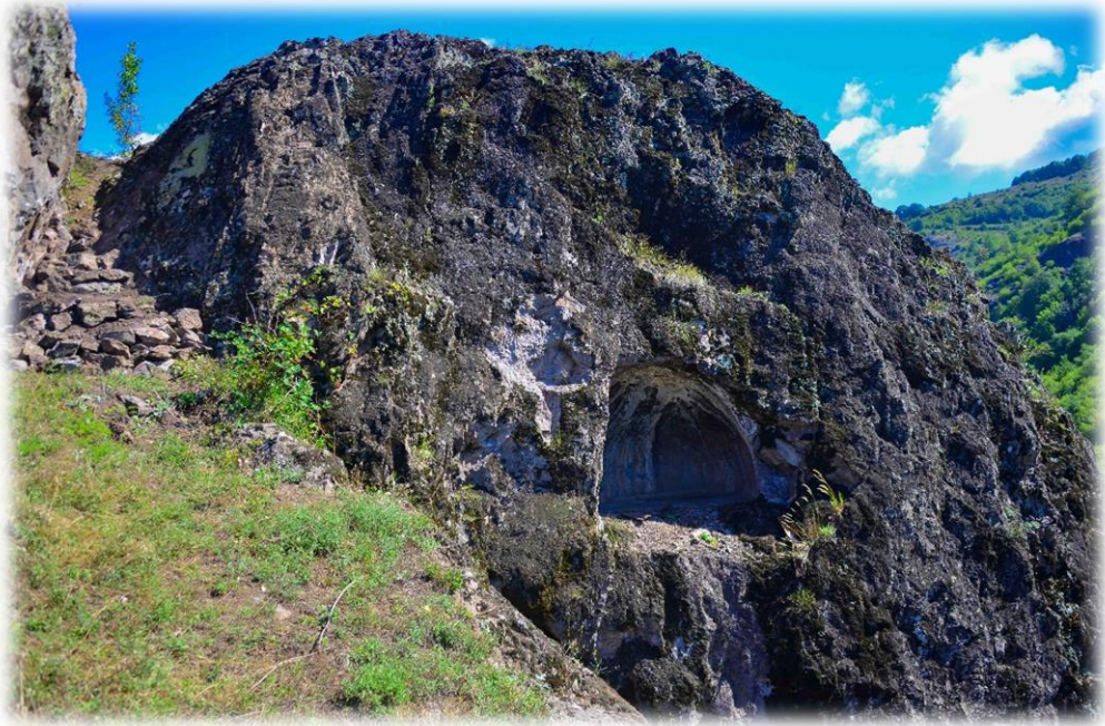
Resim 10: Ormancık Kaya Mezarı

Kevgir kalesi Akkuş ilçe merkezine 30 km uzaklıkta ve Ordu-Tokat il sınırında yer almaktadır. Kale Seferli ve Alan köyü sınırları içindedir. Aynı zamanda halk arasında kalenin adı “keygür” ve “keçi” kalesi olarak da bilinmektedir. Kale yaklaşık olarak eteğinde bulunan Tifi çayından 400 metre yükseklikte bulunup, Pontus döneminde VI. Mitirdat tarafından yapıldığı bilinmektedir (Ordu Büyükşehir Belediyesi, 2021). Kalenin çevresinde surlar bulunmakta olup, etrafı aynı zamanda uçurumdur. Ayrıca kalede gizli yollar ve oyma odalar olduğu için zamanında darphane olarak kullanıldığı tahmin edilmektedir. Ayrıca kale yakınlarında Roma sikkesi bulunduğu için kalenin Rome ve Bizans döneminde de kullanıldığı tahmin edilmektedir. Kale hem Tokat hem de Ordu turizm rehberlerinde sınırda olduğu için yer almaktadır.