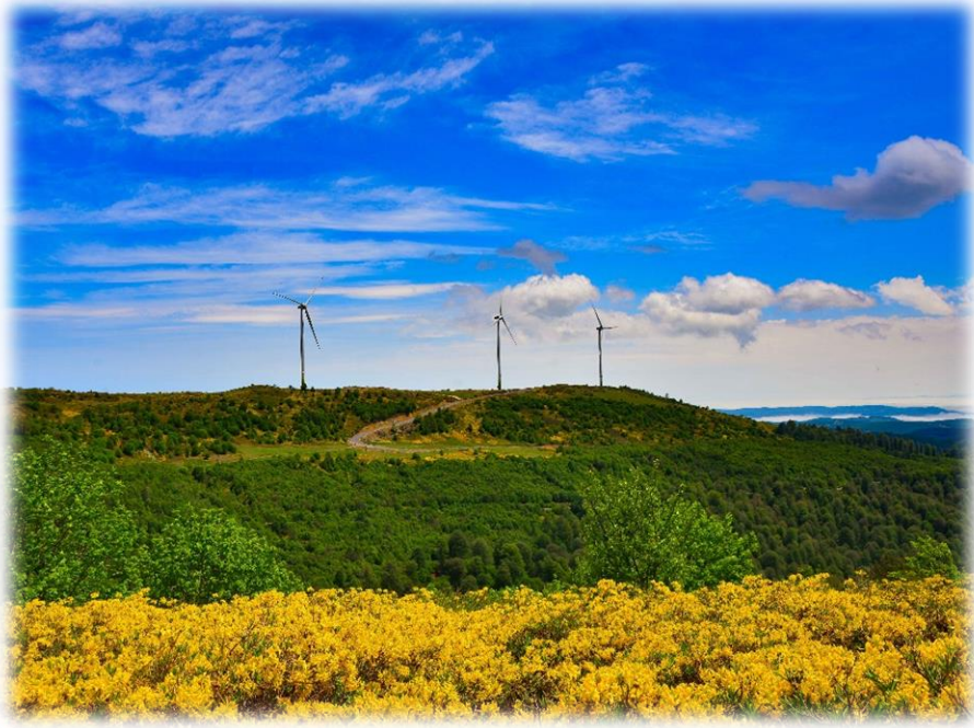
Resim 4: Taz Yaylası

Çekiçoba yaylası Akkuş merkeze 30 km uzaklıktadır. Karaçal ve Damyeri mahalleri arasında bir konuma (Ordu Büyükşehir Belediyesi, 2021) sahiptir. Yaylalar arasında Akkuş'a en uzak yayla özelliğine sahiptir. Yüksekliği yaklaşık olarak 1600 metredir. Diğer yaylalardan farkı geniş düzlük alana sahiptir. Yöre halkı tarafından ilkbahar ve yaz mevsimlerinde mera olarak kullanılmaktadır. Ayrıca Çağman ve Taz yaylarında olduğu gibi geniş alanda orman gülleri yetişen bir yerdir. Yaylaya yakın yerlerde yaşayan yöre halkı tarafından ilkbahar ve yaz mevsiminde foto safari ve piknik amaçlı kullanılmaktadır.