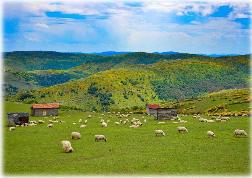
Resim 1: Çekiçoba Yaylası

Celemedin yaylası Akkuş'a 27 km uzaklıkta Ceyhanlı mahallesi mevkiinde konumlanmaktadır (Ordu Büyükşehir Belediyesi, 2021). Yayla yöre halkı tarafından hayvan merası olarak kullanılmaktadır. Yaylaya ulaşım motorlu araçlar için elverişli durumdadır. Yaylaya turistik yönden herhangi bir yatırım yapılmamış olmakla birlikte, doğallığı açısından bakirdir.