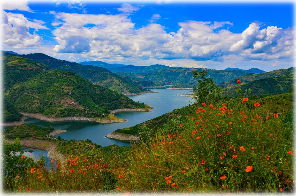
Resim 9: Çökek Yarımadası

Kurtboğaz şelaleleri merkeze 28 km uzaklıkta olup (Ordu Büyükşehir Belediyesi, 2021) Ordu'nun Çaybaşı ilçesiyle sınır olan vadi ayrımındadır. Dolayısıyla her iki ilçe tarafından da turistik tanıtımlarda kullanıldığı gözlemlenmektedir. Şelale adını da aldığı Kurtboğaz mahallesinde bulunmaktadır. Şelalenin bulunduğu akarsu boyunca birçok şelaleye veya şelalelerin oluşturduğu küçük göletlere rastlamak mümkündür. Kurtboğaz şelaleleriyle ilgili herhangi bir alt ve üst yapı çalışması gerçekleştirilmemiştir.