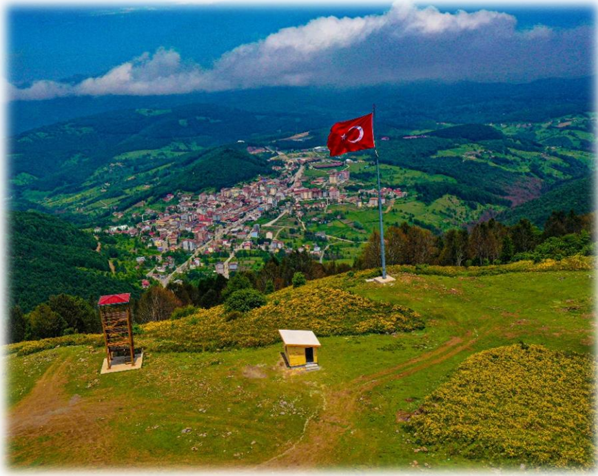
Resim 3: Argan Yaylası

Taz yaylası, Çağman yaylası ile yan yanadır. Akkuş'a uzaklığı 14 km'dir. Akkuş Koççuvaz mahallesi sınırları içinde (Ordu Büyükşehir Belediyesi, 2021) yer almaktadır. Çağman yaylasında olduğu gibi yüksekliği 1750 metre civarındadır. Diğer yaylalar gibi bu yayla da ilkbahar döneminde yöre halkı tarafından mera olarak kullanılmaktadır. Taz yaylasına 2020 yılında üç adet rüzgar türbini kurulmuş olup, bu türbinler ile rüzgardan enerji üretimi sağlanmaktadır. Çağman yaylasından renkli bir manzaraya sahip olan Taz yaylası ayrıca kuzeyinden ise hem orman güller hem de rüzgar türbinleri ile farklı ve renkli bir görüntüye sahiptir. Yerel sakinler tarafından yamaçları ilkbahar ve yaz mevsimlerinde foto safari etkinlikleri bağlamında kullanılmaktadır. Yaylaya motorlu araçlar için elverişli bir yol bulunmaktadır.