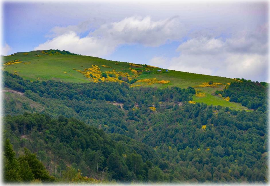
Resim 2: Çağman Yaylası

Çağman yaylası Akkuş'a yaklaşık 12 km uzaklıktadır. Ortalama yüksekliği 1750 metre civarındadır (Ordu Büyükşehir Belediyesi, 2021) ve Akkuş'un yine en yüksek konumlarından biridir. Kış dönemleri yaylada oldukça sert geçmektedir. Yaz dönemlerinde ise orman gülleriyle kaplı renkli bir manzaraya sahiptir. Yöre halkı tarafından diğer yaylalarda olduğu gibi otlak olarak kullanılmaktadır. Yayla kış turizmi için elverişli bir yapıya sahiptir. Yaz dönemlerine dahi sıcaklığı 20 dereceyi geçmeyen ve kuzeydoğuya bakan bir yamaçtır. Turistik açıdan yaylada herhangi bir alt veya üst yapı mevcut olmayıp, yolu motorlu araçlar için elverişli durumdadır. Özellikle yöre halkı tarafından foto safari amaçlı yaz mevsiminde günübirlik olarak tercih edilmektedir.