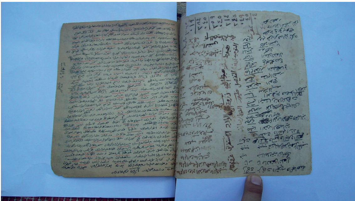
Wereqek ji Şerha Dîwana Melaya Cizirî ya Mela 'Ebdirrehimê Westanî.