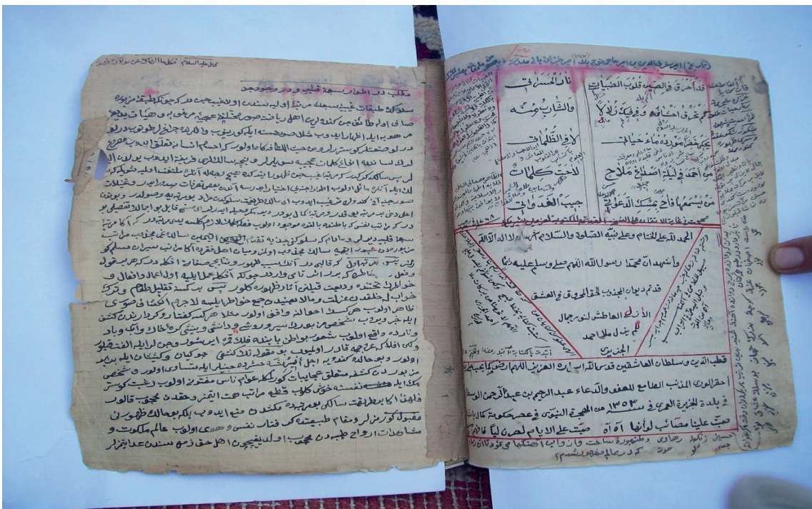
Wereqek ji Şerha Dîwana Melaya Cizirî ya Mela 'Ebdirrehîmê Westanî.