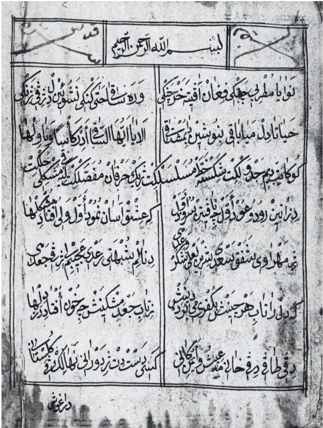
Deştpeka Dîwana Melaya Cizîrî bi deştivîsa Mela 'Ebdirrehîmê Westanî.