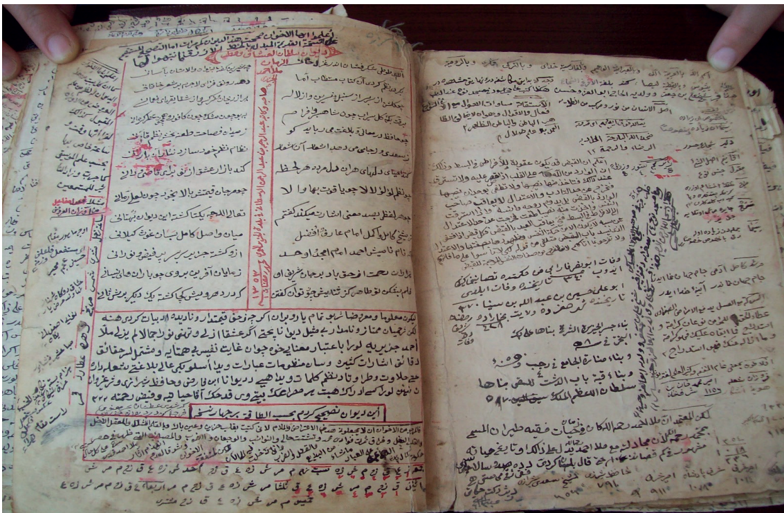
Wereqek ji Şerha Dîwana Melaya Cizirî ya Mela 'Ebdirrehimê Westanî.