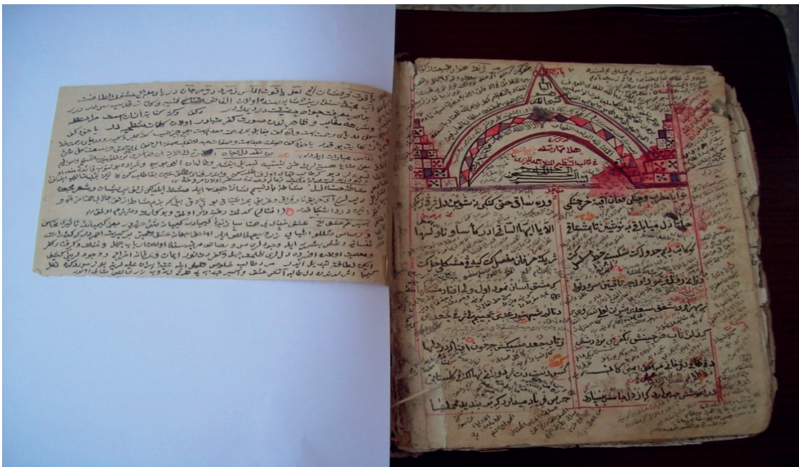
Destpêka Şerha Dîwana Melaya Cizirî ya Mela 'Ebdirrehîmê Westanî.