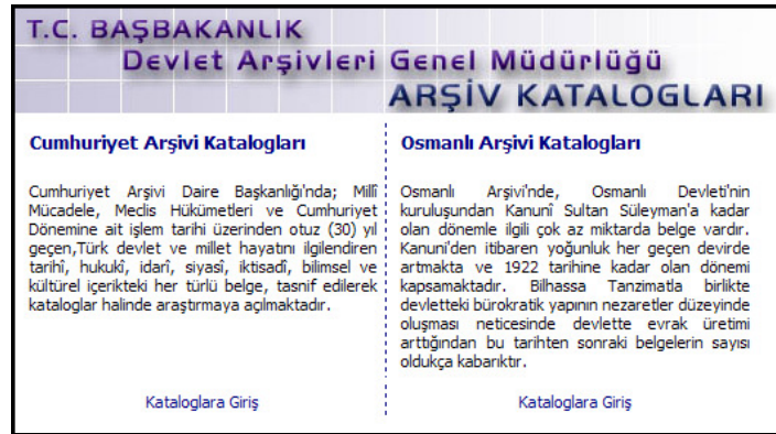
Resim 2: Katalog Seçim Ekranı (Adım 2)