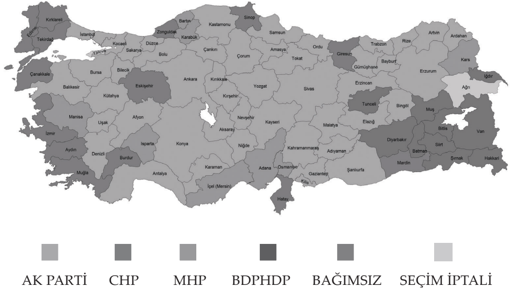
Tablo 1: Büyükşehirler ve İl Merkezlerinin Partilere Göre Dağılımı