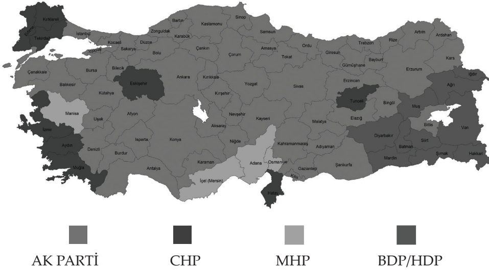
Tablo 3: 30 Büyükşehir Başkanlığına ve 51 İl Genel Meclisine Göre Türkiye Dağılımı

Bunun da ötesinde kaybettiği bazı illerde ise Muğla'da Köyceğiz; İzmir'de Menderes ve Selçuk; Hatay'da Erzin, Payas, İskenderun; Çanakkale'de Ayvacık, Ezine ve Edirne'de Enez AK Parti'nin kazandığı kıyı ilçeleri olarak öne çıkmaktadır. Ayrıca AK Parti Muğla'da bir olan ilçe belediye başkanlığı sayısını 3'e yine İzmir'de bir olan ilçe belediye başkanlığı sayısını 6'ya yükseltmiştir.