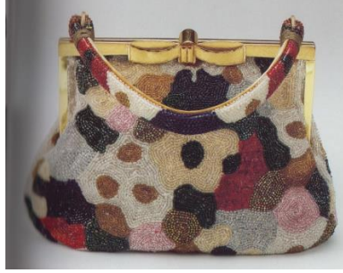
Görsel 13: Boncuk çanta.