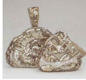
Görsel 14: Pul çanta.