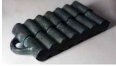
Görsel 18: Kemal Tüzgöl, “Ağır Çantaya da Eşyalarını Toplayıp Gitmek” 2012