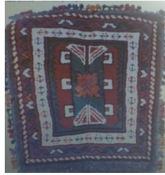
Görsel 8: Heybe.

Türk sanatında çanta yapımı, Türklerin anayurdu olan Orta Asya'ya kadar uzanmaktadır. Orta Asya'da yaşayan Türkler, özellikle dokuma çanta yapımında büyük ilerlemeler kaydetmişlerdir (Alp, 2009: s.23).