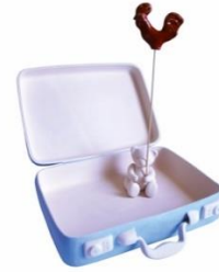
Görsel 20: Perihan Şan Aslan “Lost Suitcase IV”, Moulding, 1000 C, 2014

Sanatçı günlük yaşamda kullanılan sıradan nesnelere konu almaktadır. Taklit edilen nesnelere sıklıkla kendisine rastlanılan, rutin ve sıradan eşyalardır. Tercih ettiği nesnelere çok rastlanan, standart biçimler olmasını özellikle isteyen sanatçının çanta formunu da bu sebeple kullandığı anlaşılmaktadır (Görsel 19-20), (Aslan, 2011: s.58).