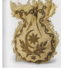
Görsel 10: Kumaş çanta

Kumaş, giyim sektöründe olduğu gibi çanta yapımında da kullanılan ve aranan malzemelerden biridir. Uzun ömürlü olması sebebiyle kullanıcının ilgisini çekmektedir (Görsel 10).