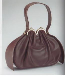
Görsel 6: Fransa çift kilitli deri çanta, 1948.

İkinci Dünya Savaşı ile yeni bir el çantası estetiği ortaya çıkmıştır. Dönemin modası savaşın etkisi ile birlikte askeri görünümlü çantaların oluşmasını sağlamıştır. Çantalar daha büyük, kareli ve pratik görünümleri ile öne çıkmaktadır. Fermuar, ayna ve deri azalmış, ahşap veya plastikten ya da suni ipek gibi yeni malzemeler kullanılmıştır. İpli çanta yeniden ortaya çıkmıştır. Büyük Britanya'daki çantalar hem gaz maskeleri taşımak hem de bir kıyafetle eşleştirmek için yapılmıştır. Fransa ve Amerika'da daha fazla kadın işgücü olması nedeniyle omuz çantaları üretilmiştir (Foster, 1982) (Görsel 6-7).