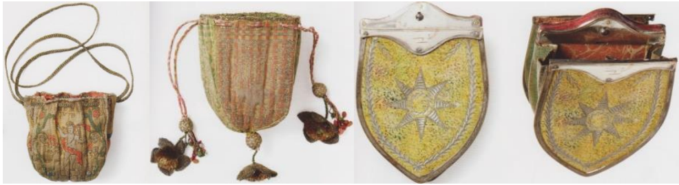
Görsel 5: 17-18 yüzyıllarına ait çantalar.

17. yüzyılda genç kızlara, evlenebilmeleri için gerekli bir beceri olarak nakış yapımı öğretilmiş ve bu da süslü, dikişli çantalarda bir artışa yol açmıştır (Critchell, 2000).