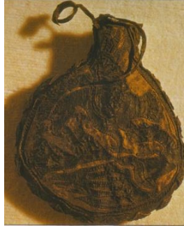
Görsel 2: İskit kesesi, M.Ö. 5.y.y.

5. yüzyılda İskit'e ait deri bir torba buluntusuna rastlanmıştır. Görseldeki torbanın yiyecek ve çakmaktaşı taşımak için kullanıldığı düşünülmektedir. Torbanın ucunda halka biçiminde bir çıkıntı bulunmaktadır. İlgili çıkıntıda kâğıt ve buna benzeyen malzemelerin taşındığı ile ilgili bilgiler mevcuttur. Torbanın hem erkekler hem de kadınlar tarafından kullanılabilmesi varsayılmaktadır (Johnson, 2002: s.19) (Görsel 2).