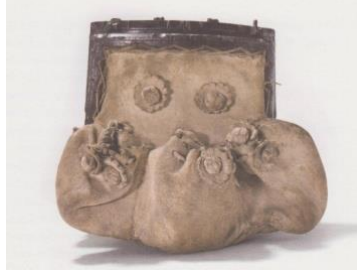
Görsel 4: 16.yy. Kemer çantası, Çanta ve Cüzdan Müzesi, Amsterdam.

16. yüzyılda, çantaların daha küçük boyutlarda yapılması, kadınların eteklerinin genişlemesine bağlanmıştır. Bu dönemde erkeklerde pantolonlarının içinde deri çantalar bulundurmıştır. Köylüler ve gezginler, çapraz takılabilen bez çantalar kullanmışlardır. Aristokratlar, kötü kokuyu telafi etmek için güzel kokulu malzemelerle dolu “ swete torbaları ” taşımaya başlamışlardır (Wilcox Currie, 1999), (Görsel 4).