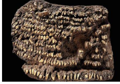
Görsel 1: Dünyanın en eski çantası, köpek dişleriyle süslenmiş.

5. yüzyılda İskit'e ait deri bir torba buluntusuna rastlanmıştır. Görseldeki torbanın yiyecek ve çakmaktaşı taşımak için kullanıldığı düşünülmektedir. Torbanın ucunda halka biçiminde bir çıkıntı bulunmaktadır. İlgili çıkıntıda kâğıt ve buna benzeyen malzemelerin taşındığı ile ilgili bilgiler mevcuttur. Torbanın hem erkekler hem de kadınlar tarafından kullanılabilmesi varsayılmaktadır (Johnson, 2002: s.19) (Görsel 2).