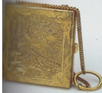
Görsel 11: Metal Çanta.

Modacıların tasarımlarında metale yer vermeleri, metalin çantada kullanım olanağını gündeme getirmiştir. Kişinin giyeceği kıyafete göre metal çantalar tercih edilmiştir. Özellikle gece toplantılarında kullanılmıştır. Ayrıca sağlamlık açısından diğer çantalara göre daha dayanıklıdır (Görsel 11), (Laçinkaya, 2019: s.15).