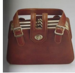
Görsel 7: Hollanda sentetik deri çanta, 1968.