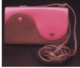
Görsel 9: Deri çanta

Deri, insanlığın var olmasından itibaren taş ve ağaçtan sonra kullanılan ilk doğal malzemedir. Çanta yapımında en çok kullanılan gereçlerdendir. Derinin tercih edilmesi dayanıklı ve uzun ömürlü olmasına bağlıdır (Görsel 9).