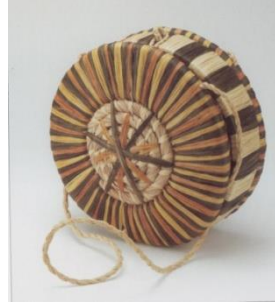
Görsel 12: Hasır Çanta

Hasır çantalar, yarılmış veya inceltmiş şeritlerin, kamışların, değişik düzenlerde sistemli olarak birbirlerinin aralarından ve üstünden geçirilmesiyle örülen çanta çeşidi olarak bilinmektedir. Değişik motifler ve örgüler ile çantaya farklı bir görünüm kazandırılır. Genellikle yazın kullanılmaktadır (Görsel 12).