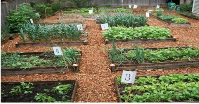
Şekil 3. Kuzguncuk Kent Bostanı

Derneği ve mahalle sakinleri tarafından korunmaktadır. Eski adıyla İlya Bostanı olarak geçen bu alan tarımsal üretimin için kullanıldığı gibi aynı zamanda sosyal bir toplanma alanı görevi de görmektedir (Şekil 3). Kuzguncuklu mimarların girişimiyle bostana ilişkin alternatif proje geliştirilerek mevcut kullanımını koruyarak, çocuk atölyeleri, dinlenme alanları, yürüyüş parkurları gibi hayaller kurulmuş, permakültür tasarımı ile bu alana ilişkin çeşitli alternatifler de geliştirilerek mahalleli ile paylaşılmıştır. Yılın belirli günlerinde bostanda şenlikler ve üretim günleri düzenlenmektedir (Sayan, H. S., 2014).