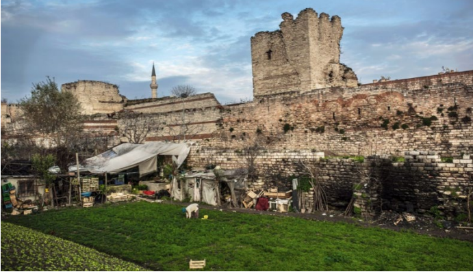
Şekil 4. Yedikule Bostanları

Türkiye’deki dernekler ve STK’ların destekleri ile oluşturulan kent bostanlarının yanı sıra dünyada da STK’lar ve toplum gönüllüleri aracılığı ile oluşturulan kentsel tarım örnekleri mevcuttur. Bu dünya örneklerinden bazılarına değinmek çalışmadaki kentsel tarım konusunun oluşumsal bağlamını güçlendirecektir.