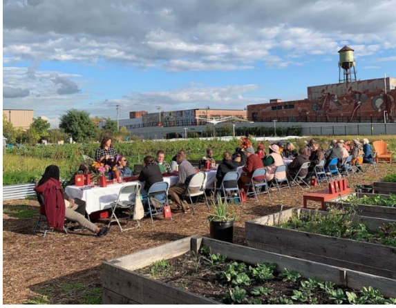
Şekil 7. Keep Growing Detroit Kent Çiftliği-ABD, Michigan, Detroit

ve yoksulluğa karşı kent bahçeleri ve çiftlikleri kurmuşlardır. Bireyler kent bahçeciliği faaliyetlerine katılırken kendilerini besleyebilmenin sağlıklı ve güvenli yollarını öğrenmişlerdir (Şekil 7). Aynı zamanda bu bahçeler farklı sosyal grupları ve kuşakları bir araya getirerek toplumun yeniden yaratılmasına aracı olmuştur (Keep Growing Detroit, 2021).