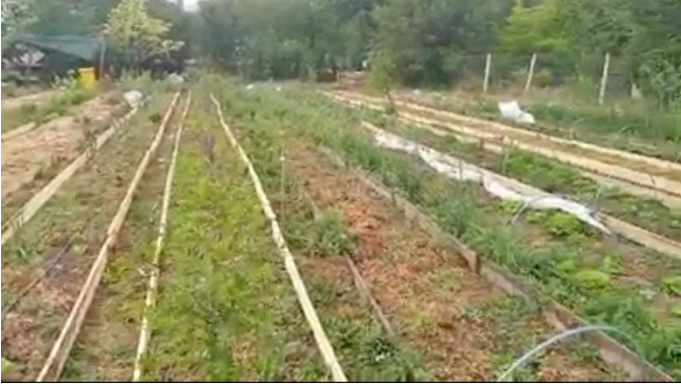
Şekil 1: Çiğdemim Mahalle Bostanı

gençlere ürün yetiştirme alışkanlıklarını kazandırmak, bitki türlerini tanıtmayı sağlamaktır (Çiğdemim Mahalle Bostanı, 2020).