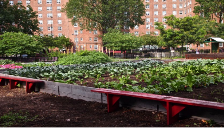
Şekil 5. Wolcott Street Farm – Brooklyn, New York