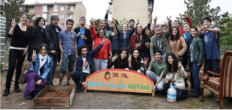
Şekil 2: Yüzcüncüyıl Berkin Elvan Bostanı

Ankara'nın Çankaya İlçesi'nde, İşçi Blokları Mahallesi'nde bulunmaktadır. Mahalle hayatının dayanışmacı ruhunu korumaya çalışan kişiler tarafından bu bostan 100. Yıl İşçi Blokları Mahallesi sakinleri tarafından 2015 yılında kurulmuştur (Şekil 2). Amaç, insanların birbirini daha yakından tanmasını sağlamak, mahalle kültürünü ve komşuluk ilişkilerini geliştirmek olarak tanımlanmıştır. '100. Yıl Mahalle Atölyesi' kapsamında '100. Yıl İnisiyatifi' adı altındaki dernek tarafından çalışmalar yürütülmektedir (100.Yıl Berkin Elvan Bostanı, 2021).