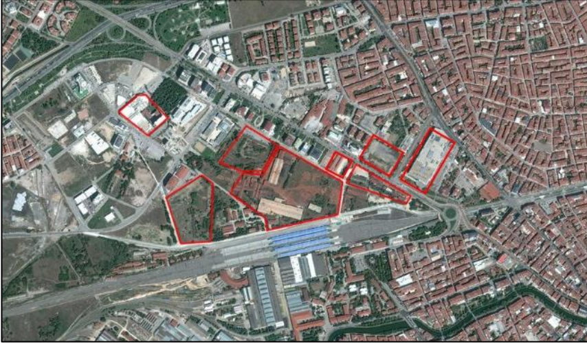
Şekil 1. Eskişehir Fabrikalar Bölgesi