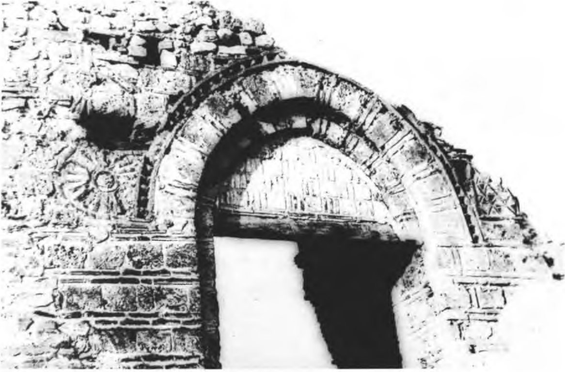
Resim 13 — Yıldırım Külliyesi darüşşifada giriş detayı.