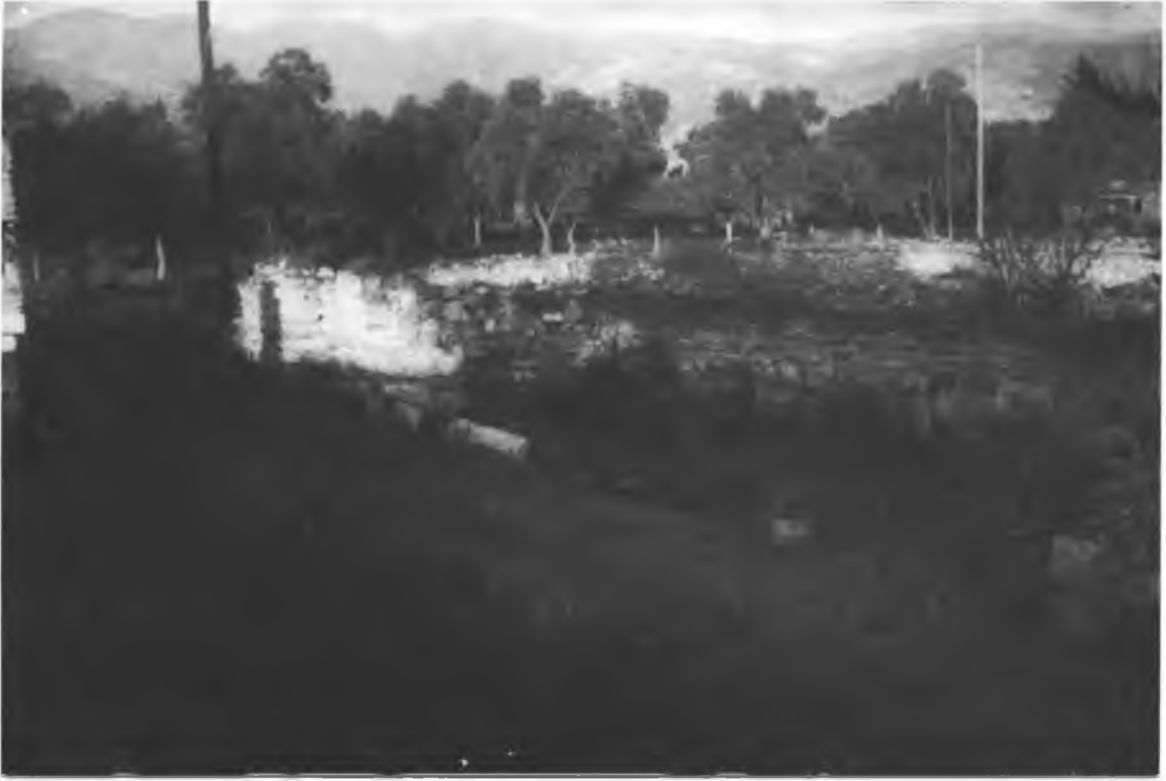
Resim 2 — Yıldırım Külliyesi tıp medresesi cephe duvarı kalıntıları.