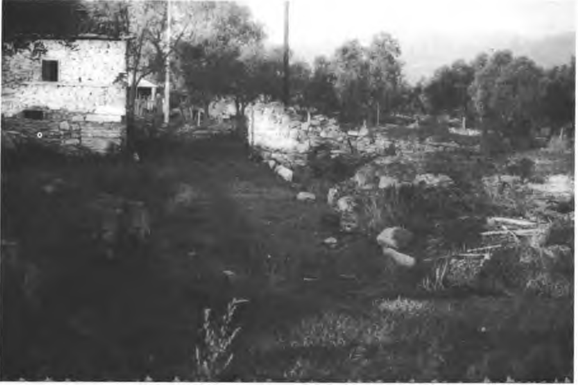
Resim 1 — Yıldırım Külliyesi tıp medresesi kalıntıları.