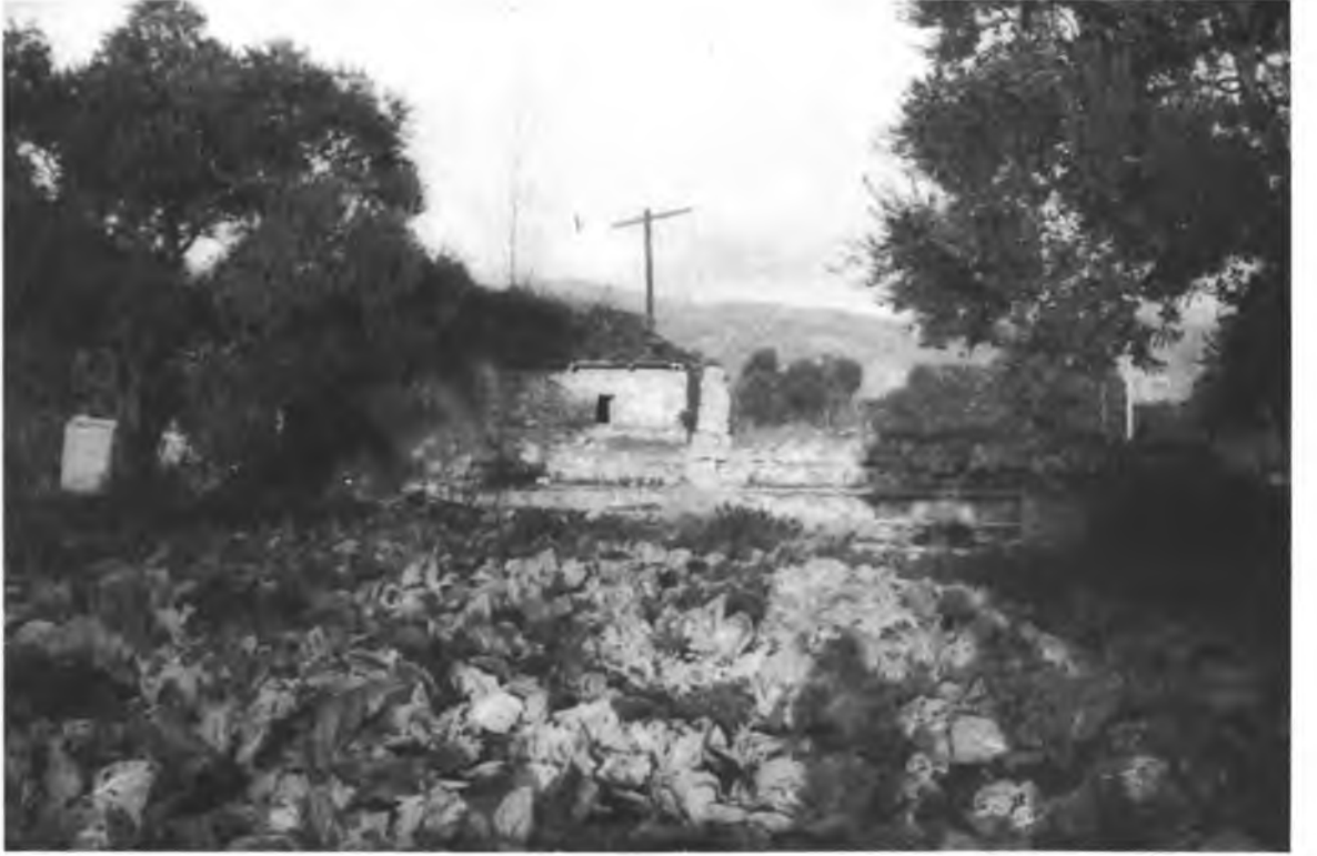
Resim 4 — Yıldırım Külliyesi tıp medresesi sağ kanat kalıntılarının genel görünüşü.