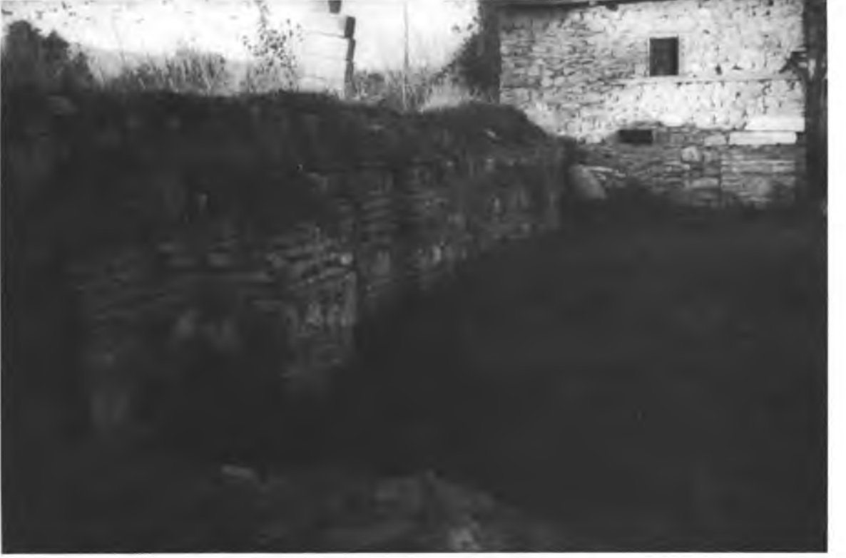
Resim 3 — Yıldırım Külliyesi tıp medresesi sağ kanadın kalıntıları.