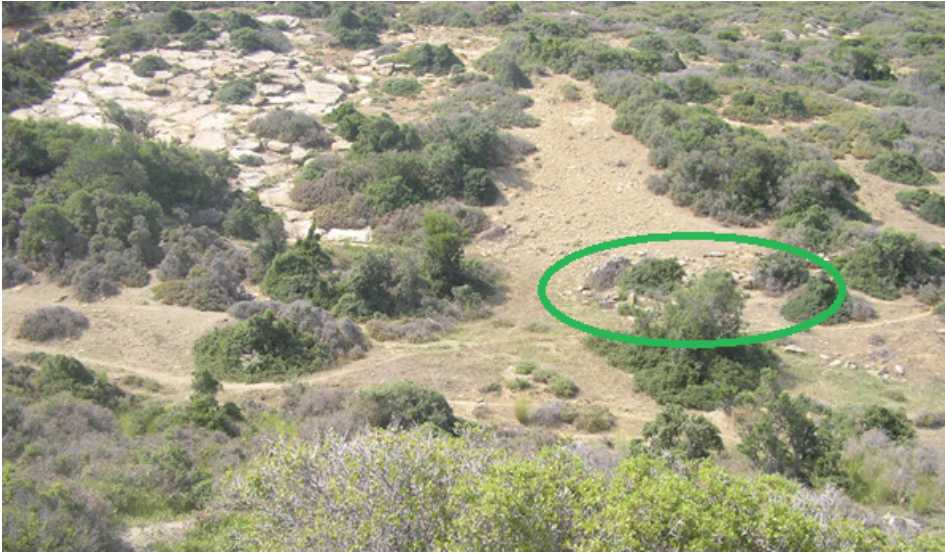
Resim 2. Olası Gelibolu Jandarma şehitliği

Belirtilen açıklamalardan da anlaşılacağı üzere Jandarma Şehitliği diye bilinen yerde Kara Kuvvetlerine mensup subaylarımızın mezarları mevcuttur. Asıl jandarma şehitlerinin mezarlığı daha batıda taşlık alanda bulunuyor (Resim 2).