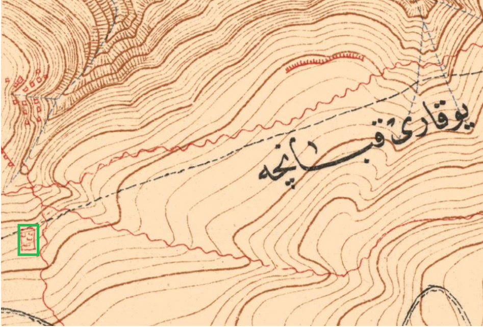
Harita 1: Yukarı Kapanca batısındaki fırka muhârebe rasadgâhı ve bugünkü jandarma şehitliği olarak bilinen mezarlık (Mehmet Şevki Paşa Haritası)

Milli Savunma Bakanlığı tarafından hazırlanan Şehitlerimiz adlı eserdeki kayıtlardan Kireçtepe’de toplam 570 kişinin şehit düştüğü görülmektedir. Bursa Jandarma Taburundan 6 kişi, Gelibolu Seyyar Jandarma Taburundan 95 kişi şehit olarak kayıtlıdır. Takviye olarak gönderilen birliklerden 127nci Alay 1, 2 ve 3’üncü Taburlardan 72, 39’uncu Alay 1’inci Taburdan 74, 19’uncu Alaydan 15, 13’üncü Alaydan 1, 17’inci Alaydan 1’inci Taburdan 31, 1’inci Alay 2’inci ve 3’üncü Taburdan 14, 126’ıncı Alay 1, 2, 3’üncü Taburlarından 85 kişi şehit olarak kayıtlıdır