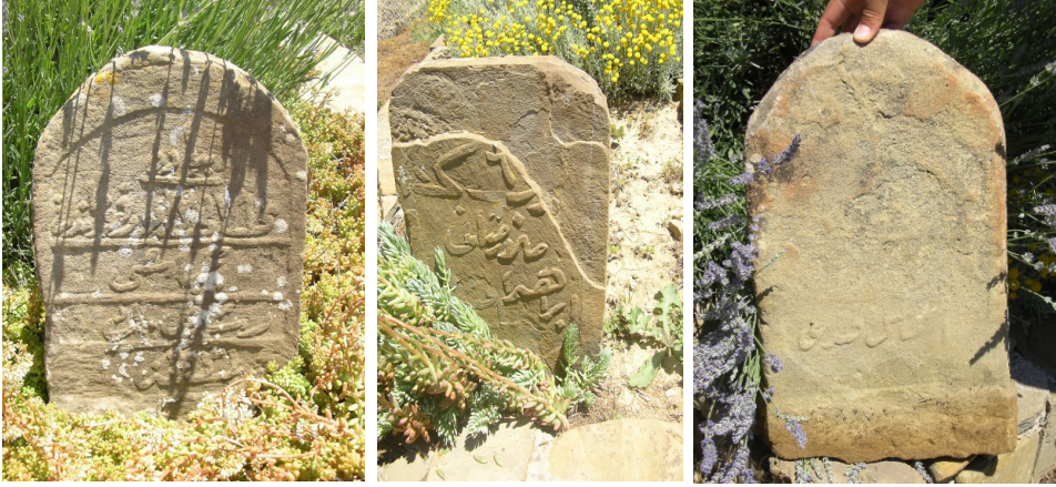
Resim 1. Mezar taşlarının o günkü durumu