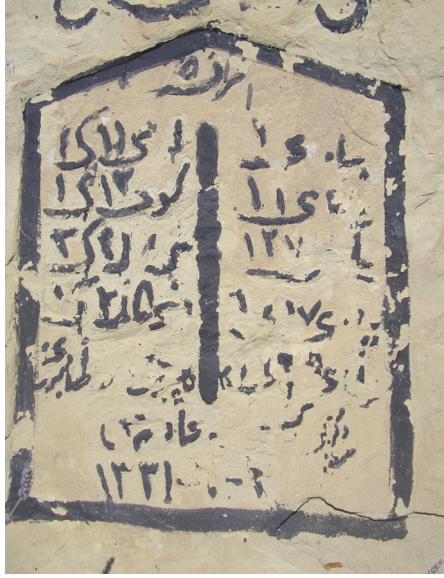
Resim 3: Anıt bilgi Kitabesi

Mehmet Şevki Paşa Haritası'ndan Kireçtepe sırtlarından Masırlıklara kadar olan arazide 4 adet şehitlik alanı olduğu anlaşılmaktadır. (Harita 2)