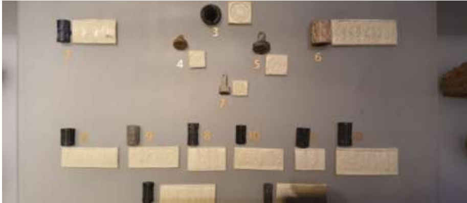
Fotoğraf 4. ve Fotoğraf 5. Asurlular dönemine ait diplomatik ve ticari tabletler ve mühürler. Anadolu Medeniyetleri Müzesinde çekilmiştir.

Yaklaşık altı bin yıl önce varlığını sürdüren Sümerlerin, kent devletleri, Mısır ve diğer bölgeler arasında ilk diplomatik ilişkiler içerisinde olduğu bilinmektedir. Ayrıca, ilginç örneklerden biri de Sümerli Danışman ve Diplomat Büyük Sargon'un bir seferden dönerken, kendisini tutuklamaya gelenlere karşı darbe yaparak Akkad devletini kurması, insanlık tarihinde bilinen ilk büyük diplomatik ve darbe olaylarından biridir.