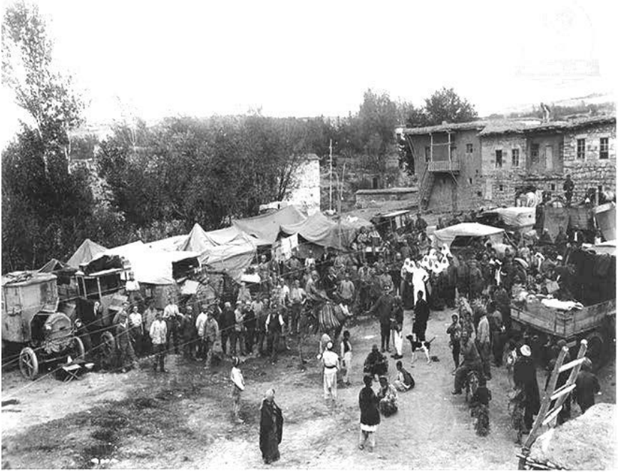
Osmanie. (Ruhetag der deutscher Abtlg. a.d. Rüdazuge)

Derneğin üyelerinin vurgusuyla “ Bakır Fabrikasında çalışmak üzere gerek Türkiye’nin diğer illerinden gerekse yurtdışından gelen teknik personel ve mühendisler ile birlikte yörenin havası kültürel olarak oldukça değişmiştir ” (K, 57). Ancak, fabrika 1994 yılında tamamen kapatılmıştır. Uzun yıllar süren bu farklı kültürel doku, fabrikanın kapatılmasıyla birlikte ciddi şekilde sarsıntıya uğramıştır. Göç alan Maden, göç veren Maden’e dönüşmüştür. İş olanağının olmaması nedeniyle, 1980 yılından sonra ilçede yaşayanlar büyük kentlere göç etmeye başlamışlardır. Gençler, Ankara ağırlıklı olmak üzere büyük kentlere göç etmişlerdir. Ankara’ya gelen Madenliler de Ankara’da kurdukları bu dernek vasıtasıyla bir araya gelmektedirler.