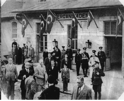
Foto 2: Mustafa Kemal Atatürk, (Ergani) Bakır Maden Tren İstasyonu, 1937