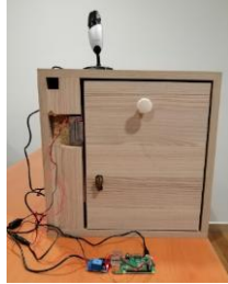
Şekil 5. Önerilen sistem prototipi.

Önerilen sistem modelinin bir prototipi Şekil 5'de görülmektedir. Sistemin maksimum güvenli olması amacı ile çeşitli teknik çözümler entegre edilmiştir. Örneğin, özel e-posta kullanılarak kapıdaki kişinin görüntüsü güvenli bir biçimde iletilmektedir. Daha da önemlisi, her iki kullanıcı tipi için bağımsız Android uygulamaları geliştirilmiş, yetki girişleri bağımsız kılınmıştır.