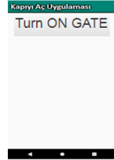
Şekil 4. Kapı açılması için istek gönderme paneli.

E-posta ile gelen kapidaGoruntu.jpg resmindeki bireyin tanıdık bir kişi olduğu yetkili kişi tarafından anlaşıldığında, kendi cep telefonunda bulunan "Kapıyı Aç" Android uygulamasını kullanır. Şifre giriş panelinden doğru bilgileri girdiğinde, Şekil 4'de gösterildiği gibi "TURN ON GATE" düğmesini içeren ekran karşısına gelir. Bu düğmeye basıldığında Algoritma 4' de gösterildiği gibi kapiyiAc.php web servisi çalışır. Bu web servisi Raspberry Pi üzerindeki Algoritma 5' gösterildiği gibi verilen Python kodunu çağırır. Kod incelendiğinde görüleceği üzere, 7. pin'e verilen gerilimle elektrikli kapı kilidi açılmış olacaktır. 5V'luk röle Raspberry Pi' nin kapı açılma esnasında maruz kalabileceği yüksek akım zararlarından korunması için kullanılmıştır.