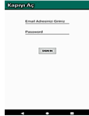
Şekil 2. "Kapıyı Aç" android uygulaması giriş paneli.

Android uygulamalarında güvenliği artırmak üzere e-posta ve şifre giriş paneli tasarlanmıştır. Bu basit ekranın görüntüsü Şekil 2'de gösterildiği gibidir. Benzer yetkili giriş ekranı "Kapıda Kaldım" Android uygulaması içinde kullanılmaktadır.