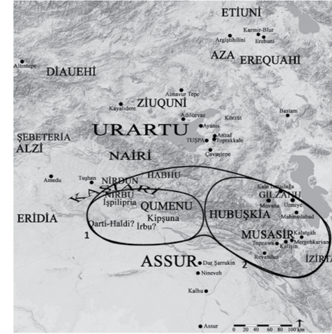
1. Assur kayıtlarına göre Haldi ile ilişkilendirilebilen coğrafya. 2. Musasir ve çevresi.