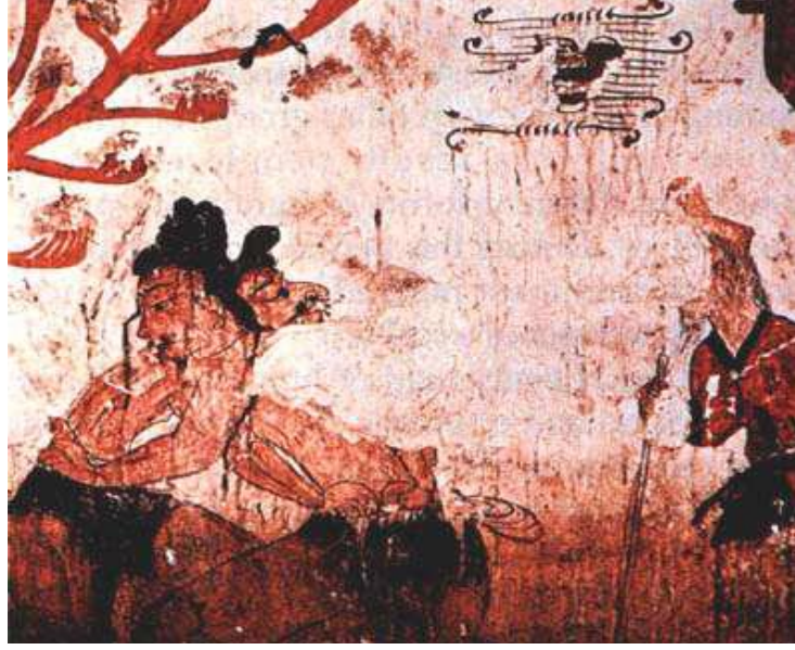
Resim 3: Ssireum güreşine bir örnek