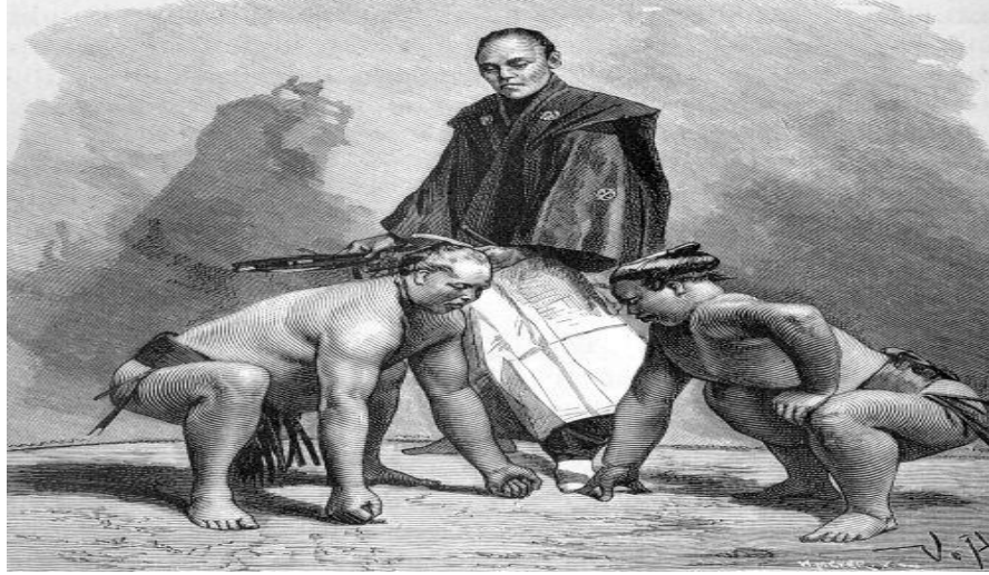
Resim 2: Sumo Karşılaşması yapan sporcular.