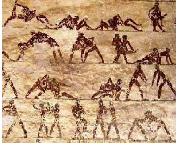
Resim 11: Nuba güreşinin gösteren kaya resimleri(Carroll, 1998).