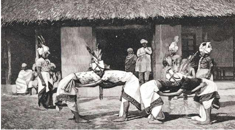
Resim 7: Mukana güreşi yapan sporcular

Mizoram bölgesindeki yerli halkın yaptığı diğer bir güreş şekli ise, Inbuan'dır. Çin'den göçen halk toplulukları burada yerli halkı kendi boyundurukları altına almışlardır. Bu topluluğun güreş tarzı Inbuan olarak adlandırılmaktadır. Geleneksel söylentide Inbuan güreşinin kökeni A.D 1750'lerdeki Dungle köyüne dayanmaktadır. Inbuan güreş tarzının çok sıkı kuralları vardır. Güreşçilerin bellerine bağlanan materyal çok sıkı bağlanır, güreşçiler çemberin dışına çıkınca ve hatta dizlerinin bükülmesi durumunda da birbirine hamle yapmazlar. Güreş alanı çember şeklinde 15-16 fit çapındadır. Bu güreşteki amaç, kurallara bağlı kalarak rakibinin ayaklarını yerden kesmektir. Güreş karşılaşmaları 3 raunt üzerinden yapılır ve her raunt 30-60 saniye arasında sürer. Maç bir güreşçi kural ihlali yapana kadar veya rakiplerden biri diğer rakibin ayağını yerden kesene kadar devam ederdi (Scotland, 2008).