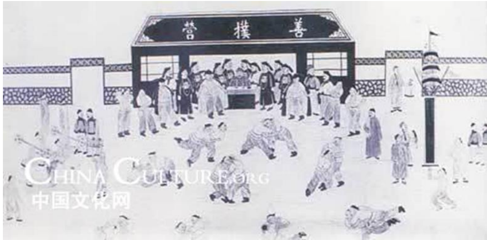
Resim 1'de, Juedi güreşi yapan Çinliler görülmektedir ( http://www1.chinaculture.org ).