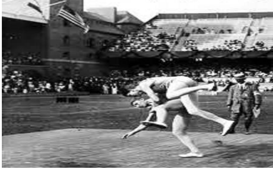
Resim 8: Glima güreşi yapan sporcular