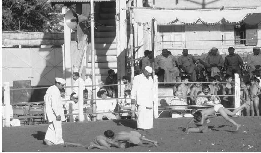
Resim 6: Kushti yapan çocuklar