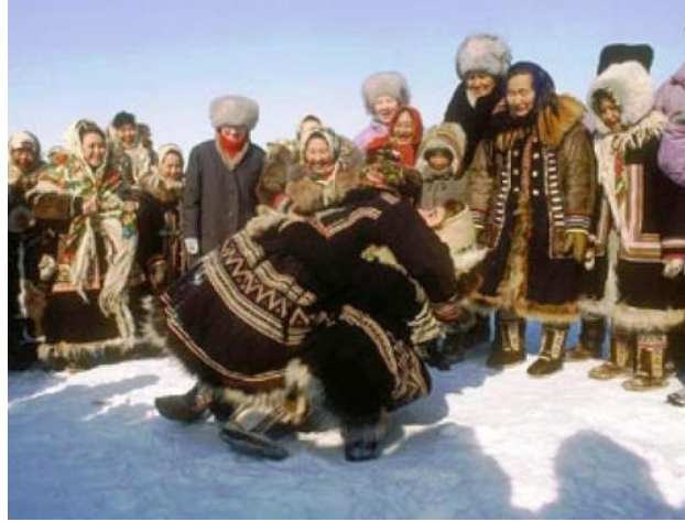
Resim 13: Toruasa güreşi

( http://www.fscclub.com/vidy/small-nganasan-e.shtml : Erişim Tar; 29.12.2017).