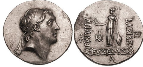
Fig. 1. Kral V. Ariarathes Sikkesi (BMC Galatia, no. 5, 354)

Konumuz itibarıyla değineceğimiz krallık rejimindeki siyasi kriz ise MÖ 163-157 11 arası döneme