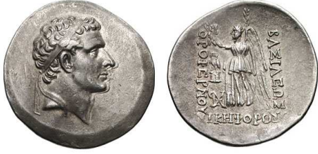
Fig. 2. Kral Orophernes'in Nikephoros (Muzaffer) Epietli Sikkesi (BMC Galatia, no. 5, 354)

kilerde görev alan diğer kişilere de özen gösterici bir tutum sergileyerek meşruiyetini kanıtlamıştı 22 .