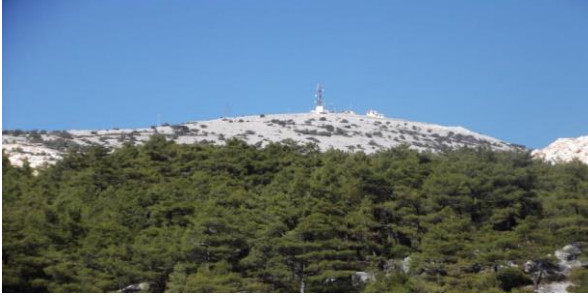
Şekil 1. Kurukümes Dağı Aksivri Tepesi

Çalışma alanımız olan Kurukümes Dağı'nın kuzeyinde Kayabaşı, güneyinde Tuzabat ve Korucuk, doğusunda Yatağan, batısında Milas yerleşim yerleri yer almaktadır ve dağın en yüksek zirveleri Kocakır (1026m) ve Aksivri (1373m) tepeleridir.