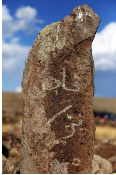
Kargapazarı Şehitliğinde bir mezar taşı

toplamışlardır. Kazım Yurdalan Erzurum'a geldiğinde, bunlar için o günün şartlarında civardaki taşlardan bir mezar yeri yaptırmış, ancak yıllar içinde mezarlar kaybolmaya başlamıştır. Yıllardır bu mezarların yerini biliyordu ancak onların da bu mezarlar hakkında pek bilgisi yoktur.