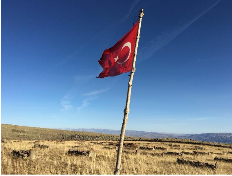
Kargapazarı Şehitliğinde Dalgalanan Türk Bayrağı*

daha önce bölgedeki savaflara dair yazılan kitaplarda okuduğum gibi Kargapazarı'ndaki Türk Şehitlerine ait olduğunu anladım. Çoban Çocuğa “Bunlar Türk askerlerinin mezarları.” dediğimde çocuğun gözleri doldu. Birkaç gün sonra daha kapsamlı araştırma yapmak üzere bölgeye gittiğimde mezarların başında tahta bir çubuğa asılı Türk Bayrağının dalgalandığını gördüm. O küçük çoban nereden bulduysa bir bayrak bulmuş ve bir çubuğa bağlayarak oraya dikmişti. Bu tarihten sonra da, o bayrak orada dalgalanmaya devam etti.”(Bayram, 2017)