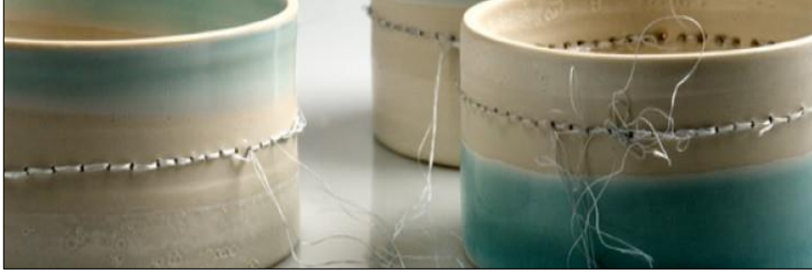
Görsel 2. Cath Ball, “Dikişli Porselen Kase”, 17 x 17 x 6 cm, Porselen ve Pamuk İpliği

bu hisle izleyiciyi; geleneksel işleme teknikleri ile porselen çamurunun geleneksel kullanımı arasında bırakarak nesnelerin nasıl yapıldığını sorgulatmayı (Honnor, 2012) amaçlamaktadır (Görsel 2).