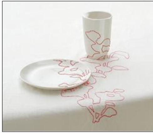
Görsel 1. Hella Jongerius, “İşlenmiş Porselen Sofra Örtüsü”, 80 x 120 cm, 1999

Bu yaklaşımlardan ilki seramik malzemenin yüzeyine işlemlerin uygulanabileceği deliklerden oluşan bir alanın oluşturulduğu gruptur. Bu gruptaki seramiklerin yüzeyine delikler ya şekillendirme sırasında bünye deri sertliğindeyken ya da pişirilmiş bünyenin yüzeyine waterjet veya 3 boyutlu yazıcılar kullanılarak biçimlendirilmesiyle oluşturulmaktadır. Bu gruptaki sanatçı ve tasarımcıların eserlerindeki örneklerin ortak noktası seramik malzemenin katılığının üstüne bir şey işleyebilmenin oluşturduğu tezatlığı seramik malzemenin fonksiyonunun dışlanarak esere ait bir öğeye dönüştürmesi olduğu söylenebilir.