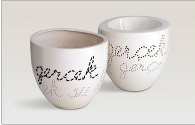
Görsel 6. Burcu Öztürk Karabey, “Gerçek”, 24X22x2cm, 2011

sırasında oluşturulmuş deliklerde el yazısı ile “gerçek şu ki” yazmaktadır. Deliklerden oluşan yazının yalnızca “gerçek” yazan bölümüne siyah deri ipe uyguladığı işleme ile Karabey, kişinin özünde kendine tanıklık ederek kendisiyle yüzleşmesi gerçeğini anlatmaktadır.