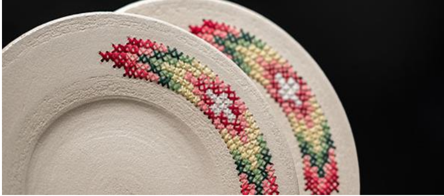
Görsel 3. Beate Ingebretsen

Cath Ball’ın uygulamalarında kullandığı yöntemi kullanarak bir grafiker olan Beate Ingebretsen de görsel iletişimle bağlantılı projesinde seramik tabaklar üzerine, bir çeşit geleneksel Norveç Giysisi olan bunadların işlemlerinden ilham almış (Ingebretsen, 2013) seramik tabaklarının kenarına bordür biçiminde kanaviçe desenini işlemiştir (Görsel 3).