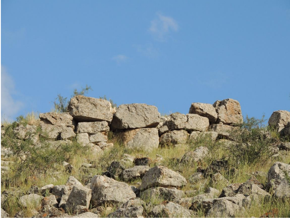
Res. 2: Akçukur Erken Demir Çağı Yerleşmesi Kuzey Sur Duvarı