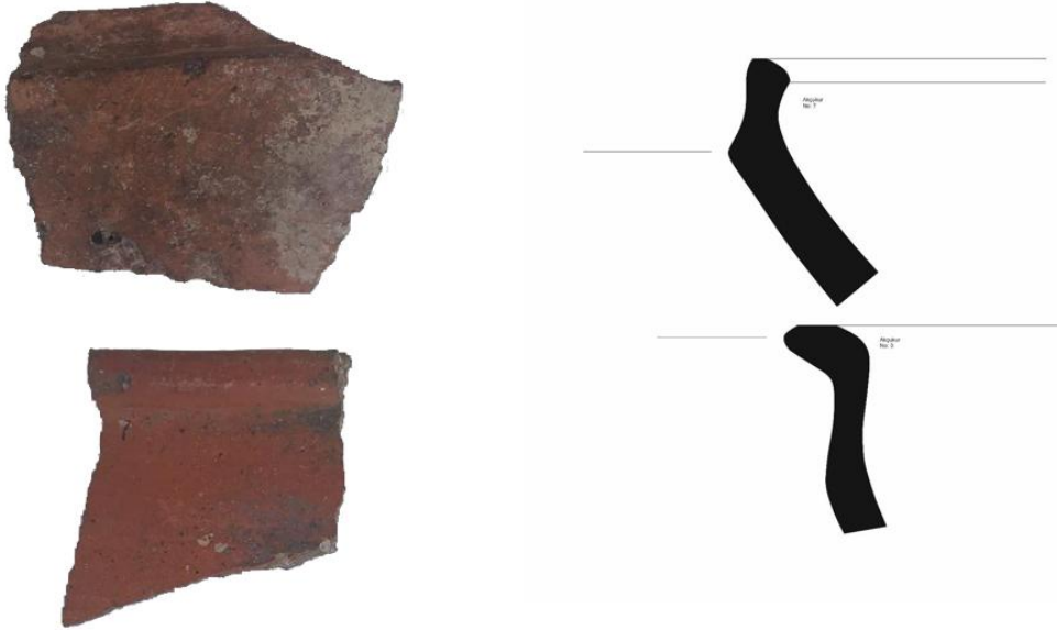
Res. 5: Akçukur Erken Demir Çağı Yerleşmesi çanak çömlekleri