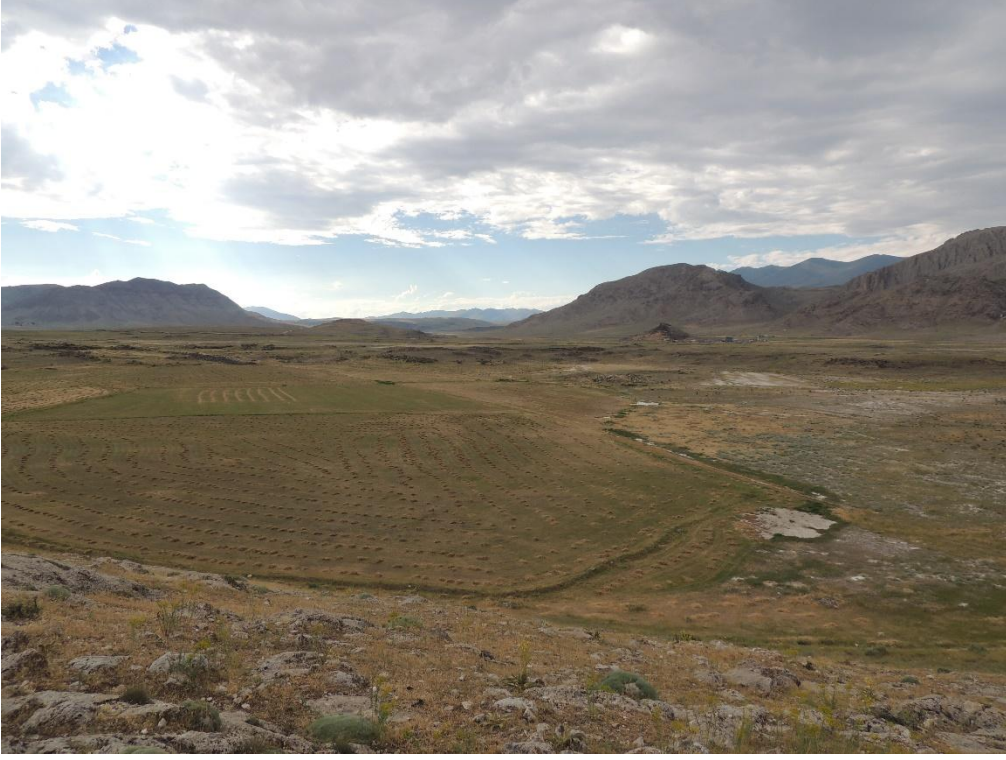
Res. 4: Akçukur Erken Demir Çağı Yerleşmesi ile Kalus Kalesi arasındaki tarım arazileri