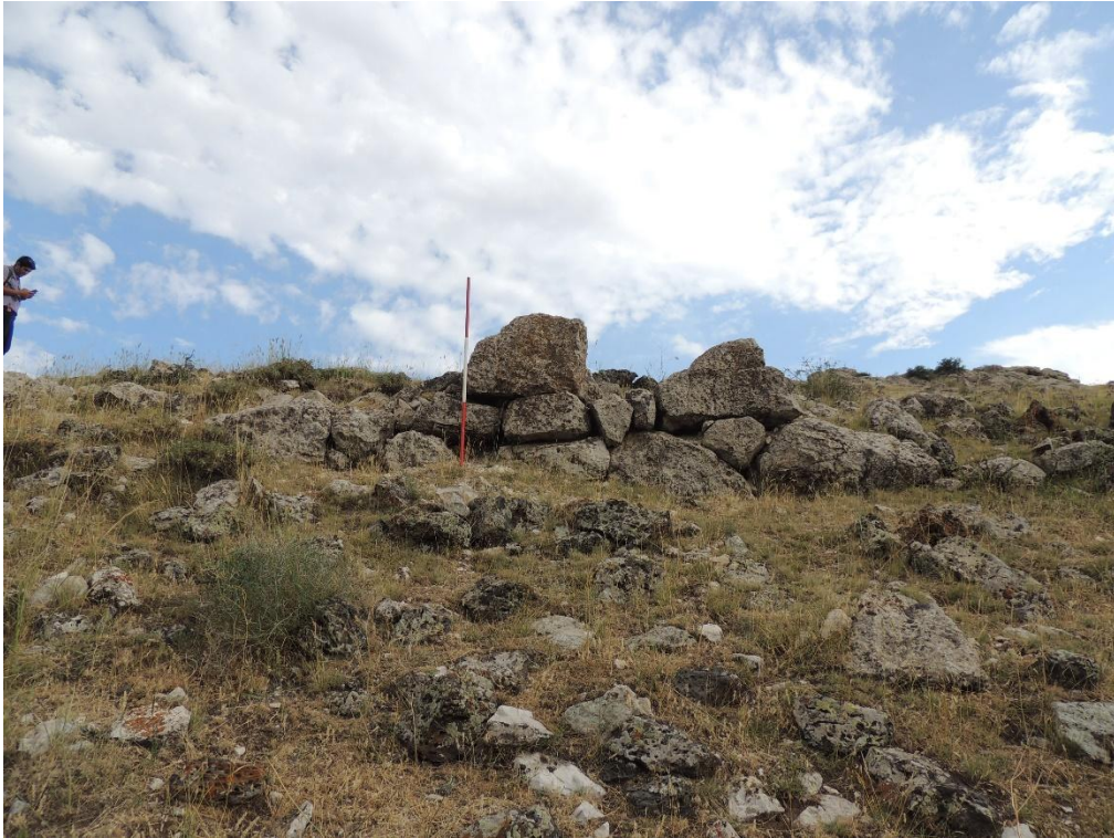
Res. 3: Akçukur Erken Demir Çağı Yerleşmesi Duvar İşçiliği