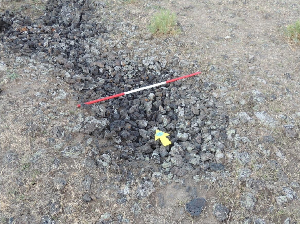
Res. 6: Akçukur Erken Demir Çağı Yerleşmesine ait taş yığma kurgan mezarlar