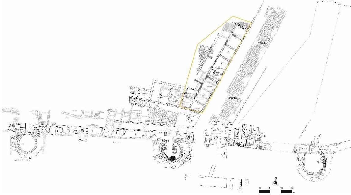
Resim 2: 2020 Yılı Agora Kazı Alanı

dükkanların kapıları genelde doğu yönde bulunan portikoya açılacak şekilde yapılmıştır. Hemen hemen tüm kapılar 1.60-1.70 metre genişliğe sahiptir.