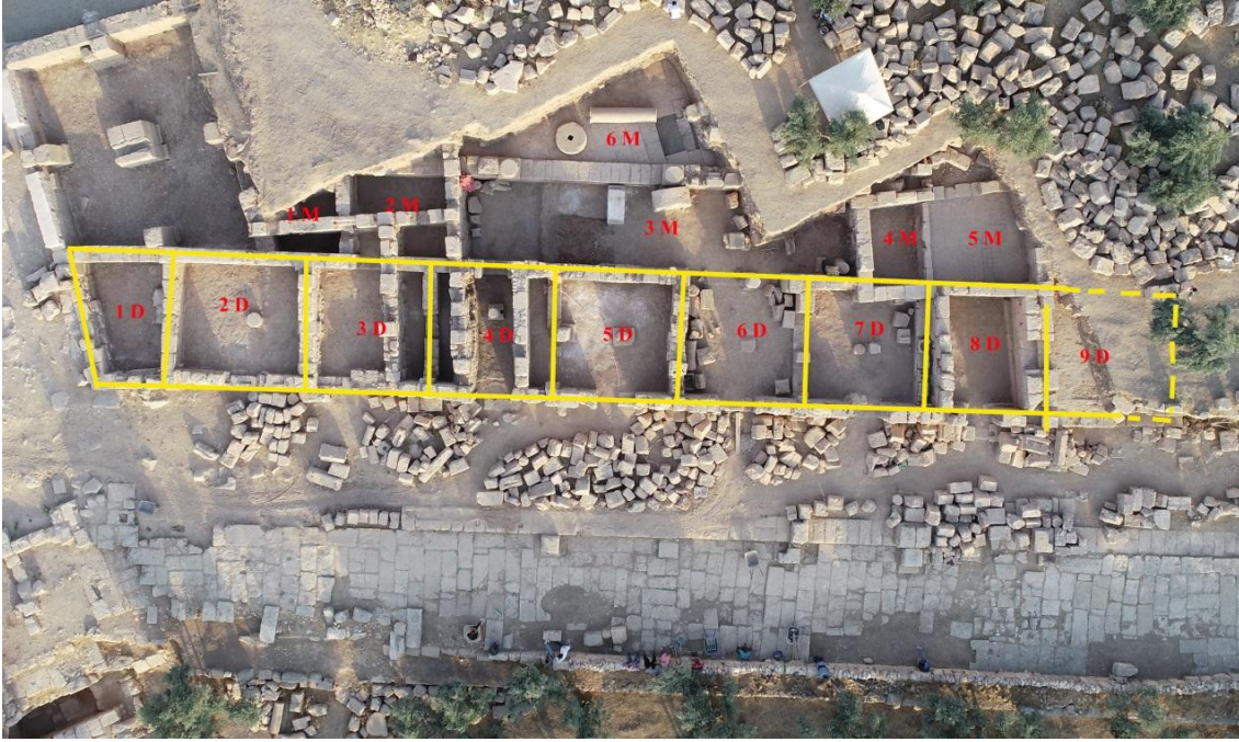
Resim 3: Agora Dükkanları ve M.S. 6. Yüzyıl Duvarları

İncelenen kandiller içerisinde K1-K9 nolu örnekler birbirine yakın form ve bezeme ile üretilmiştir. Kalıp yapımı eserlerde oval gövde yapısı buruna doğru keskin form alır. K1 ve K2’de bu yapı biraz daha yumuşak hat ile sağlanmıştır. Hiçbirinde diskus bulunmaz. Bunun yerine geniş bir yağ deliği tercih edilmiştir. Yağ deliği çevresi plastik bir boyun ile belirginleştirilmiştir. İlave olarak yağ deliğini çevreleyerek fitil deliğinde son bulan geniş bir kanal mevcuttur. Bu yapı kandile işlevsellik kazandırmıştır. Olasılıkla yağın hazneye aktarımı esnasında taşan bölümü bu kanal ile fitil deliğinden içeri yağ deliğine dolmaktaydı. K-K9 örneklerinin tamamının omzunda küçük bir tutamak bulunur. Söz konusu tutamak biçimi kandil kalıptan çıkarıldıktan sonra küçük bir hamur parçası elle şekillendirilerek üst kalıba applike edilmiştir. Bu nedenle kulplarda tam bir benzerlik saptanamamıştır.