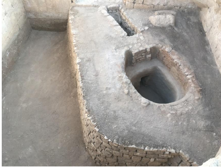
Resim 4: 13 No'lu Burçtaki Fırın (Restorasyon Sonrası)

gerekir (Res. 4). Söz konusu fırın ve işlik ele alınan kandillerin üretimiyle doğrudan ilintili değildir. Zira daha geç dönemleri olasılıkla M.S. 11-13. yüzyılları işaret etmektedir. Doğru bir mantık kurmak gerekirse, ele geçen arkeolojik verilere göre kentin en zayıf olduğu, kısa bir süre sonra terkedildiği dönemlerde seramik üretimi Dara'da söz konusu ise, erken dönemlerde üretimin olması kuvvetle muhtemeldir. Zira geç dönem işlik ve fırınları kentte seramik üretim geleneğinin olduğunu kesin olarak belgelemektedir. Şüphesiz ileriki kazı sezonlarında daha kesin bilgiler edinilecektir.