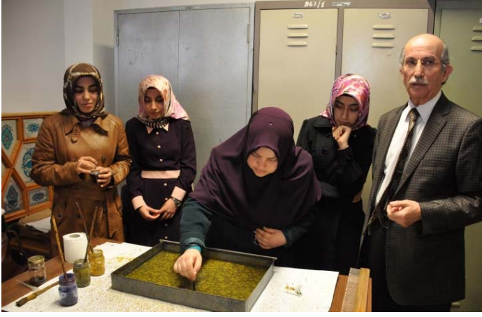
Ebrû kursu öğrencileriyle tekne başında uygulama yaparken... (2015)