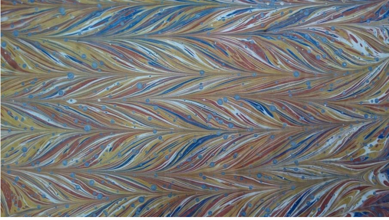
Hocamın 2000 yılında yaptığı şal ebrûsu.