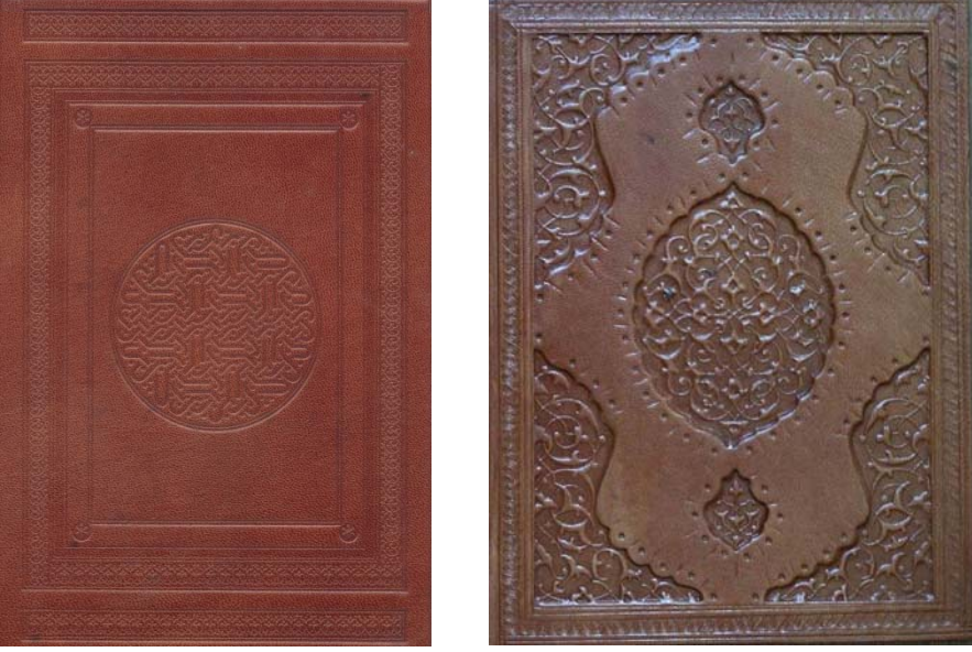
Hocama ait bazı cildler.

(Solda: Selçuklu dönemi röprodüksiyon cild. Sağda: Osmanlı dönemi klâsik, soğuk şemseli cild.)