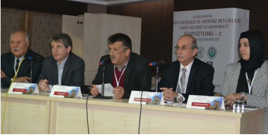
Uluslararası Karamanoğulları Beyliği Sempozyumu'nda.