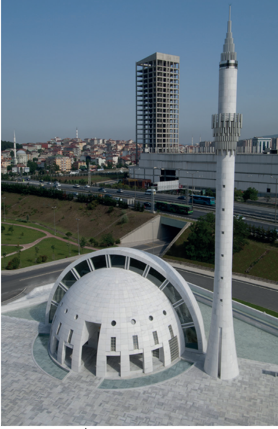
Resim 14- İstanbul Yeşil Vadi Camii. Minare .