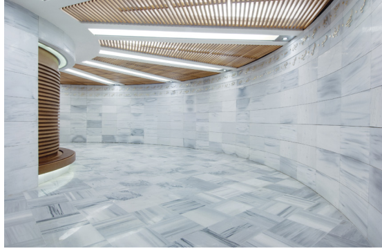
Resim 21- İstanbul Yeşil Vadi Camii. Toplantı salonu fuayesi.