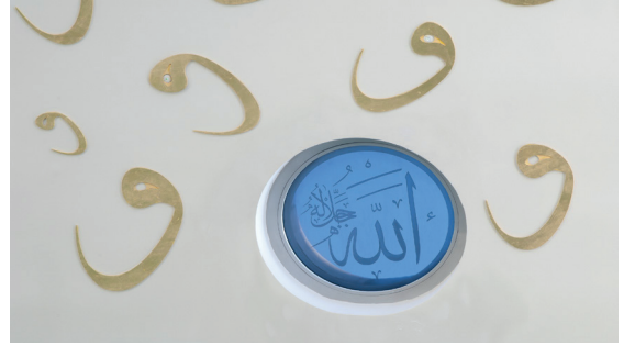
Resim 8- İstanbul Yeşil Vadi Camii. Harimdeki lomboz pencereler.