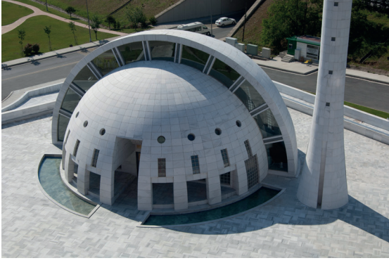
Resim 4- İstanbul Yeşil Vadi Camii. Kapı.