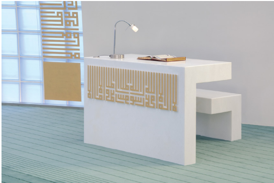
Resim 10- İstanbul Yeşil Vadi Camii. Vaaz kürsüsü.