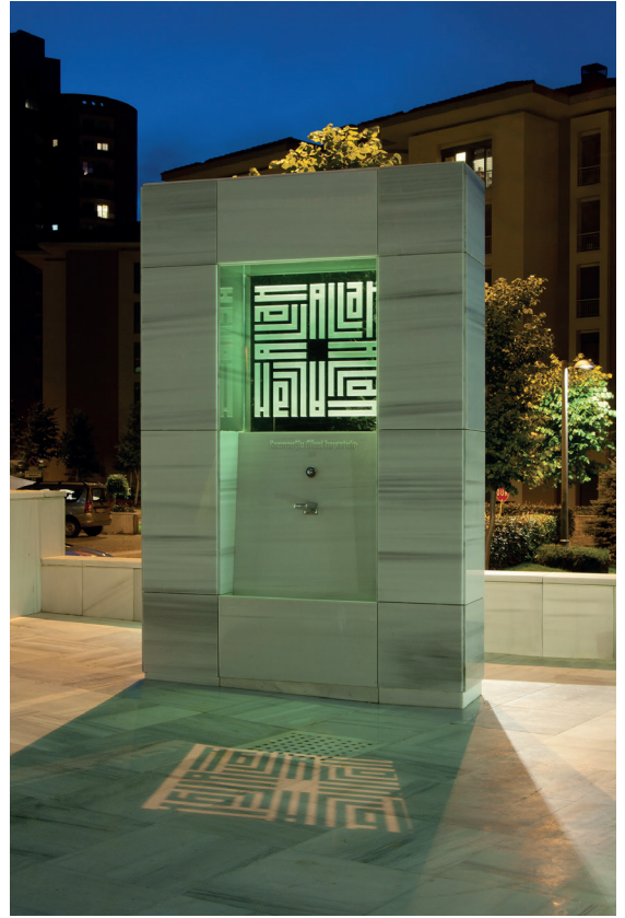
Resim 17- İstanbul Yeşil Vadi Camii. Çeşme.