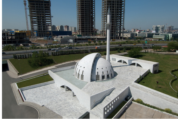
Resim 1- İstanbul Yeşil Vadi Camii. Genel görünüş

Şener-Sofuoğlu-Yıldırım, 2011: Şener A., Sofuoğlu M. C., Yıldırım M. Yüce Kur'an ve Açıklamalı Yorumlu Meali, Ankara.