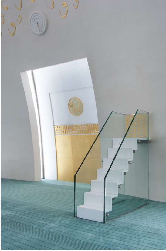
Resim 9- İstanbul Yeşil Vadi Camii. Mihrap ve minber.