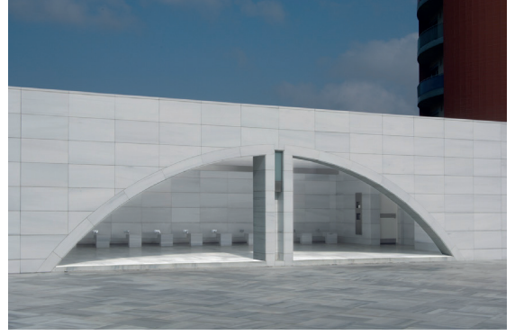
Resim 16- İstanbul Yeşil Vadi Camii. Şadırvan.