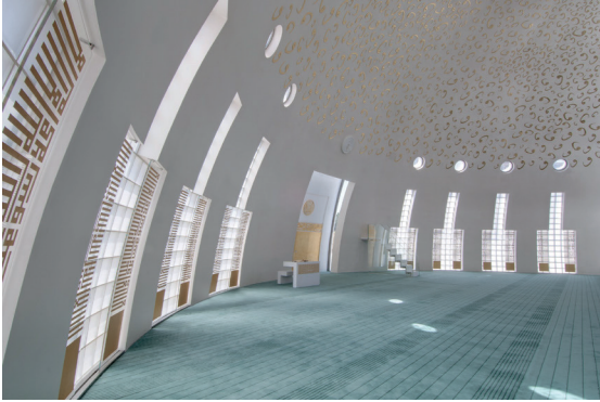
Resim 6- İstanbul Yeşil Vadi Camii. Harim