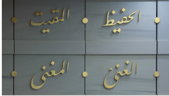
Resim 22- İstanbul Yeşil Vadi Camii. Toplantı salonu fuayesi.