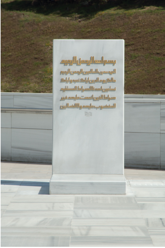
Resim 18- İstanbul Yeşil Vadi Camii. Musalla taşı.