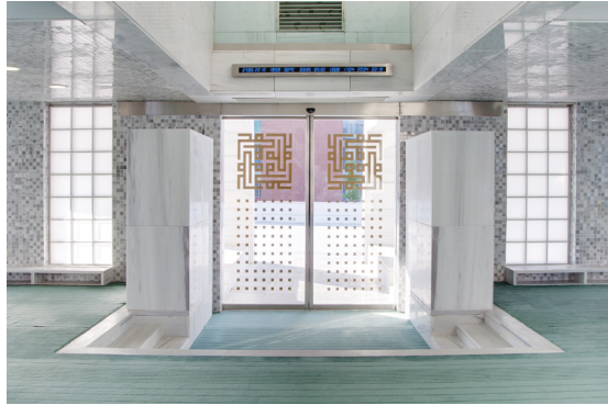
Resim 12- İstanbul Yeşil Vadi Camii. Kapı, içten görünüş.