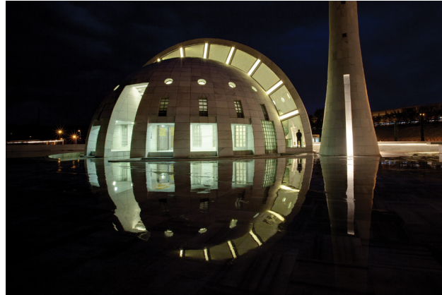
Resim 2- İstanbul Yeşil Vadi Camii. Genel görünüş