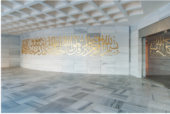
Resim 19- İstanbul Yeşil Vadi Camii. Toplantı salonu girişi.