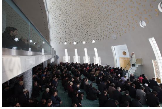
Resim 11- İstanbul Yeşil Vadi Camii. Harim.