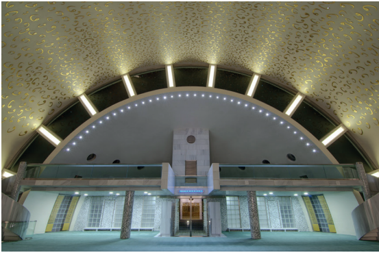
Resim 5- İstanbul Yeşil Vadi Camii. Kapının içten görünüşü ve kadınlar mahfili.