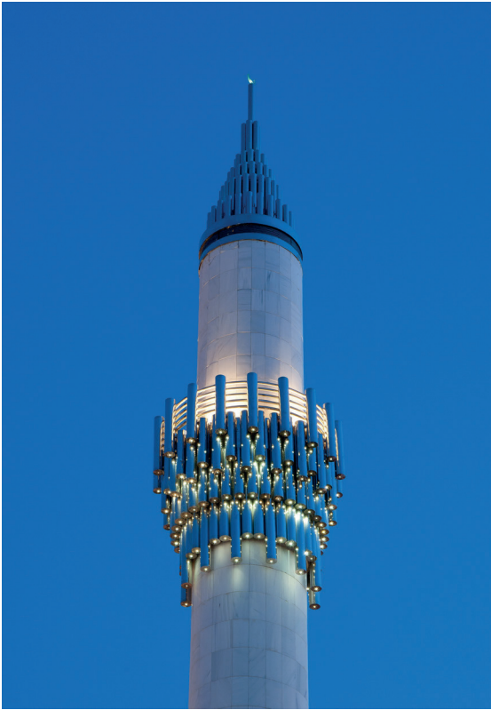
Resim 15- İstanbul Yeşil Vadi Camii. Minare şerefesi.