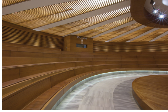
Resim 20- İstanbul Yeşil Vadi Camii. Toplantı salonu girişi.