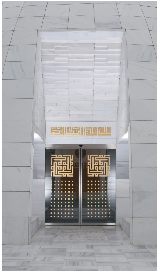
Resim 13- İstanbul Yeşil Vadi Camii. Kapı, dıştan görünüş.