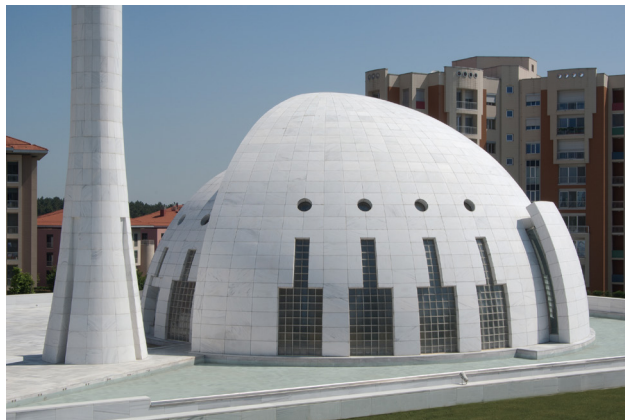
Resim 3- İstanbul Yeşil Vadi Camii. Mihrap cephesi.