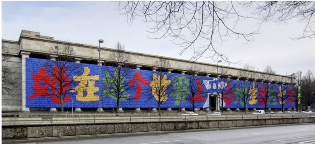
Şekil 10: Ai Weiwei, Hatırlama, 2009, Münih, Almanya.

Ai depremde ölen çocukların isimlerini saptamak için bir platform oluşturmuştur. Kampanyaya katılanlarla, 5000'den fazla çocuğun yaş ve ismini belirten bir liste meydana getirmiştir. Weiwei bu bilgileri sosyal medya hesabında duyurmuştur. Hükümeti kızdıran bu eylem sonucunda Ai Weiwei'nin bloğu kapatılmış ve evinin önüne yerleştirilen güvenlik kameralarıyla 24 saat izlenmiştir (Shiller, 2013, s. 10). Şanghay'da bulunan stüdyosu Şangay yönetimi tarafından 2010'da yasadışı ilan edilerek yıkılmıştır. Stüdyosunun yıkılmasına tepki olarak bir nehir yengeci şöleni vermiştir. Nehir yengeci Çin'de çok severek tüketilen bir yiyecektir fakat çağdaş kültürde yıkıcı unsurlar anlamına da gelmektedir. Bu şölenin anısına 1200 porselen yengeçten oluşan He Xie (Nehir yengeci) adlı çalışmasını yapmıştır (Görsel 9).