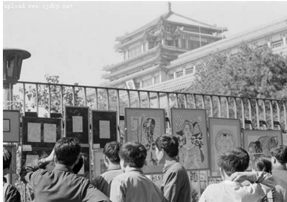
Şekil 2: Yıldızlar Grubu Sergisi, 1979. Beijing Ulusal Sanat Müzesi'nin dış mekânı

Ai Weiwei, geçirdiği çocukluk sebebiyle çok genç yaşta hükümet karşıtı fikirlerle dolmuştur (Sikes, 2013:16). 1975 yılında Pekin'e ailesi ile birlikte geri dönen Weiwei, 1978'de Pekin Film Akademisi'ne kaydolmuştur. Kültür Devriminden sonra açılan ilk sınıfta animasyon eğitimi almıştır. Çin Komünist Partisi ise, sanatta Sovyet türü gerçekçilik ve Çin halk sanatı dışında üretim yapmayı yasaklamıştır (Çil, 2017).