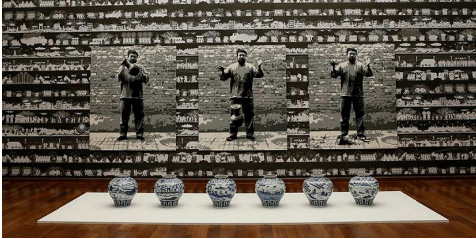
Şekil 6: Ai Weiwei, Han Hanedanlığı Vazosunu Düşürmek (1995) adlı performansa ait fotoğrafın lego versiyonu, 2016, Sakıp Sabancı Müzesi, İstanbul.

Ai, 1995 yılında Pekin'de başladığı Perspektif (Görsel 5) adlı performansa dayalı ikinci fotoğraf serisinin ilk işinde Tiananmen Meydanı'na doğru kolunu uzatmış, orta parmağını yukarı kaldırmıştır. Bu imgeyle izleyiciden, otoriteye, hükümetlere ve kurumlara gösterilen sorgusuz sualsiz saygıya meydan okumalarını talep etmiştir. Bu çalışma Eyfel Kulesi, Beyaz Saray ve Alman Parlamento Binası gibi kültürel ve siyasal iktidar mekânlarında halen devam etmektedir (Rosenthal vd, 2018, s. 61).