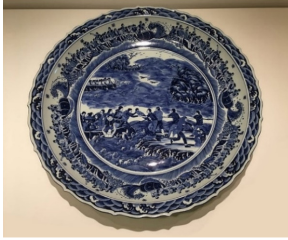
Şekil 14: Ai Weiwei, Mavi-Beyaz Porselen Tabak, 2017, Sakıp Sabancı Müzesi, İstanbul. Kaynak: https://www.vignetteinteractive.com/ai-weiwei-refugees-new-odyssey/ (Erişim: 04.04.2018).

Mültecilerin zorlu yolculuklarını ve kıyıya varduktan sonra yaşadıkları sorunları konu alan Human Flow adlı bir de film projesine başlamıştır. Ai, bu film için mültecilerin bulunduğu 20'den fazla ülke gezmiştir. Amacı insanları yaşanan bu göçmen trajedisinden haberdar etmektir. Son bir yılda açtığı 10 sergide mültecilerle ilgili eserlere yer vermiştir (Ai, 2017). Sakıp Sabancı Müzesi'ndeki sergisinde ise bizzat şahit olduğu göçmen sorunlarını porselen tabakların üzerine ve duvar kâğıtlarına kendini de bir mülteci gibi göstererek resmetmiştir (Görsel 14, 15).