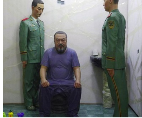
Şekil 11, 12: Ai Weiwei, S.E.C.R.E.T., 2013, Sant'Antonin Kilisesi, 55. Venedik Bienali.