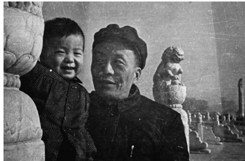
Şekil 1: Ai Weiwei ve babası Ai Qing, 1958

Çin Kültür Devrimi döneminde, Ai Qing sağcılıkla suçlanıp ailesiyle birlikte Çin'in Heilongjiang Eyaleti'ne bağlı Beidahuang'a sürgün edilmiştir. (Rosenthal vd., 2018, s. 184) 1959 yılında, Çin'in kuzeybatısında bulunan 550.000 kişinin yer aldığı yarı askeri işçi kampı Shihezi'ye nakledilmiş ve 1975'e kadar yaşamını burada sürdürmüştür. Bu süreçte babası Ai Qing'e yazma yasağı getirilmiştir. Gündüzleri tuvalet temizliği yapan Ai Qing akşam eve geldiğinde, o zamanlar çocuk olan Weiwei'ye Viladimir Mayakovski, Nazım Hikmet Ran, Pablo Neruda gibi öne çıkan şairlerden şiirler okumuştur. Weiwei, çocukluğunu işçi kampında babasından şiir dinleyerek geçirmiştir. İstanbul'da verdiği konferansta sanatçı kimliğinin oluşmasında bu şiir dinlemelerinin etkisi olduğunu belirtmiştir (Ai, 2017).