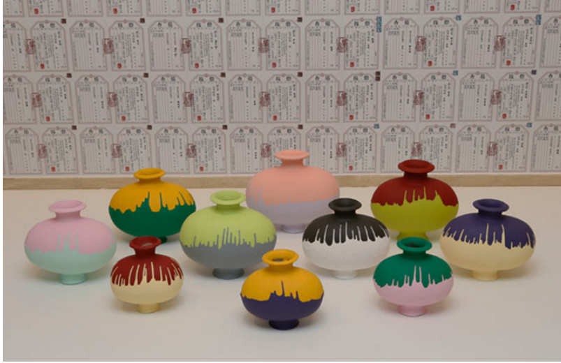
Şekil 7: Ai Weiwei, Renkli Vazolar, 2010, Sakıp Sabancı Müzesi, İstanbul.

Renkli Vazolar (Görsel 7) adlı eserinde de benzer şekilde Kültür Devrimi'nin geçmişi yok etmesi ve bugünkü Çin ekonomisinin standartlaştırıcı etkisine dikkat çekmektedir. Hanedanlık dönemine ait vazoları bu defa, endüstriyel boyalara batırarak değerlerinin nereden kaynaklandığını sorgulamıştır (Rosenthal vd, 2018, s. 76-126).