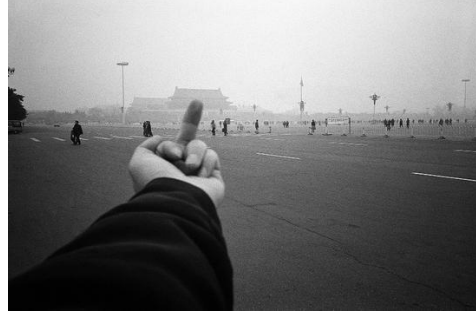
Şekil 5: Ai Weiwei, Perspektif, 1995, Pekin.