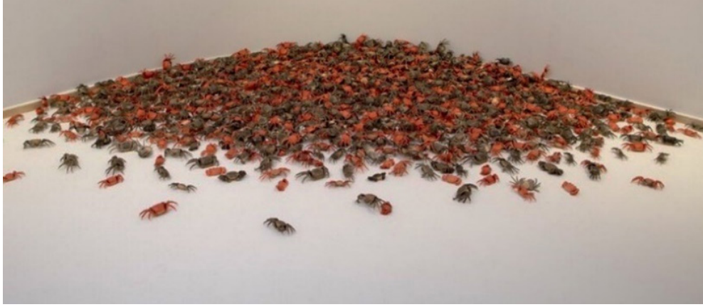
Şekil 9: Ai Weiwei, He Xie (Nehir Yengeci), 2012, Sakıp Sabancı Müzesi, İstanbul. Kaynak: https://twitter.com/SSabanciMuze/status/919138180875595776 (Erişim:04.04.2018).