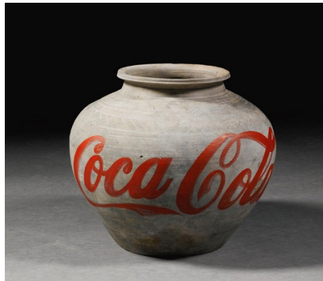
Şekil 4: Ai Weiwei, Coca Cola, 1994.

New York Ethan Cohen/Art Waves'de açtığı ilk sergiye neredeyse hiç katılım olmamıştır. Yapıtlarının az sayıda izleyici tarafından izlenmesi Ai Weiwei'yi umutsuzluğa sürüklemiştir. İstanbul'daki konferansında; bu sergi bitiminde işlerini, galeri sahibine bırakmak ya da çöpe atmak istediği; onları taşıyacak gücü bulunmadığı hatta sanatta başarısız olacağı kaygısı taşıyan ifadelerde bulunmuştur (Ai, 2017).