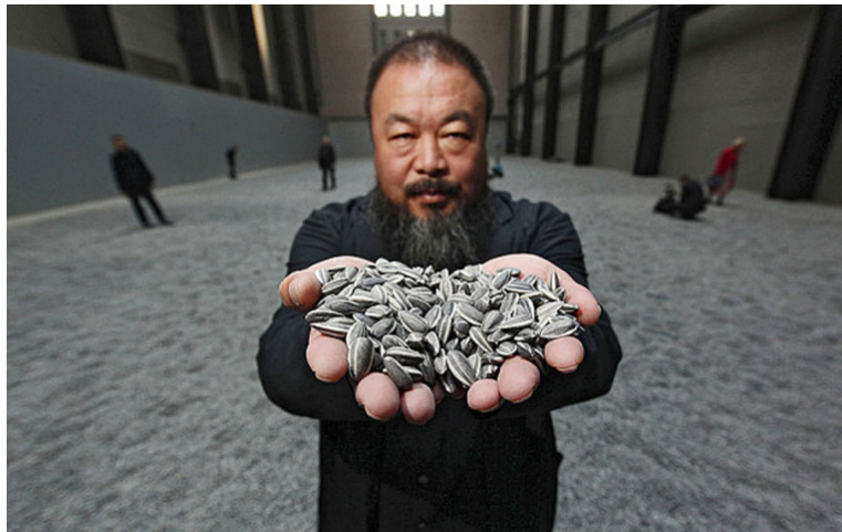
Şekil 8: Ai Weiwei, Ayçiçeği Çekirdekleri, 2010, Tate Modern, Londra.

Ai Weiwei'nin dünya çapında bilinen bir sanatçı olmasında önemli rol oynayan çalışması, 2010 yılında Londra Tate Modern'in Turbine Hall'ünde sergilediği Ayçiçeği Çekirdekleri'dir. Yerleştirme, sanatçının yapıtlarında sahicilik, bireyin toplumdaki rolü, kültürel ve iktisadi alışverişin jeopolitiği gibi yinelenen konuları içermektedir (Görsel 8). Ayçiçeği Çekirdekleri, Mao Zedong'u güneş, yurttaşları da ona doğru dönmüş ayçiçekleri olarak betimleyen Çin Kültür Devrimi propaganda posterlerini anımsatmaktadır (Rosenthal vd, 2018, s. 153).