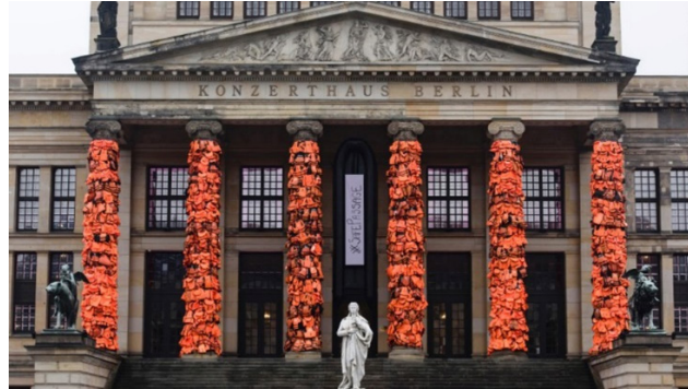
Şekil 13: Ai Weiwei, 66. Berlin Film Festivali için Konzerthaus Binası, 2016, Almanya.

2013'de gözaltı sürecinde bulunduğu ortamı anlatan S.E.C.R.E.T. (Görsel 11, 12) adlı enstalasyonu yapmıştır. Bu çalışma, Sant'Antonin kilisesinin ana mekânına yerleştirilmiş; yaklaşık 1,5 metre yükseklikteki altı kutudan oluşmaktadır. Dışarıdan siyah görünen dikdörtgen biçimli kutuların içinde sanatçının sorguya çekilirken, gündelik hayatındaki uyuma, yeme, yıkanma, tuvalet, yürüme gibi temel ihtiyaçları karşılamasıyla ilgili durumları iki gardiyanla birlikte görülmektedir (Yardımcı, 2013).