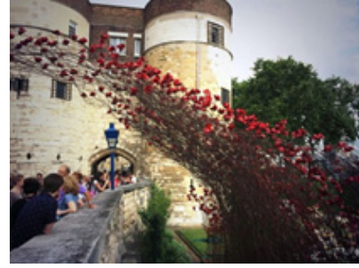
Fotoğraf 4-5: Paul Cumins ve Tom Piper,Kan, Toprakları ve Denizleri Kırmızıya Boyadı Enstalasyonundan görünüm, 2014, Londra Kalesi