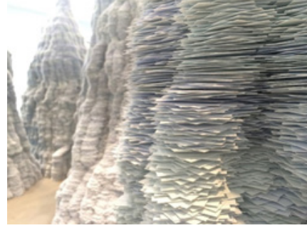
Fotoğraf 1-2: Tara Donovan, Untitled, 2014 , New York Pace Gallery.

https://design-milk.com/millions-pieces-sculptures-tara-donovan/