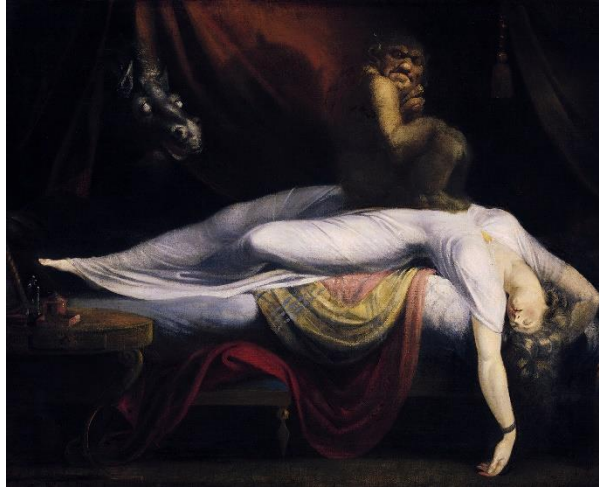
Görsel 4. Henry Fuseli (Johan Heinrich Füssli) , Kabus, 1781, t.ü.y.b., 101,6 x 127 cm (URL 4).

Doğayı sömürme yönündeki kapitalist ilke, onunla uyum içinde yaşama yönündeki romantik özlemle çelişir. Ayrıca toplumsal değerlerin çöküşü, tüm niteliksel insanı bağların çözülmesi, hayatın tek tipleşmesi, insanların kendi aralarındaki ve doğayla ilişkilerinin tamamen yararcı olması şeklindeki modern toplumun tüm olumsuz özelliklerinin sezgisel olarak hissedenlerin çoğu romantiktir.