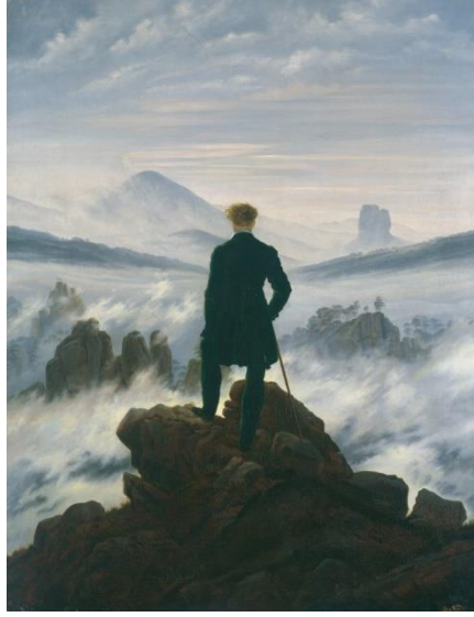
Görsel 2. Caspar David Friedrich, Bulutların üzerinde yolculuk, 1818, t.ü.y.b., 98,4 x 74,8 cm (URL 2)

“Engin kırların, işlenmemiş büyük bir çölün, birbiri üzerine yığılmış belirsiz dağ kitlelerinin, kayalıkların ya da derin uçurumların ya da uçsuz bucaksız suyun görünümü; bunlarda bizi etkileyen ne nesnenin yeniliği ne de güzelliğidir; bizi etkileyen doğanın olağanüstü yapıtlarında görülen şu sert ve kaba görkemdir. Bir nesne tarafından yutulmayı ya da kendi sınırları içinde kapatamayacağı bir şeye sarılmayı sever imgelemimiz. (Claudon, 2006: 9)