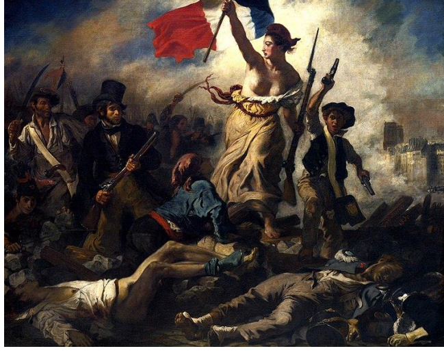
Görsel 1. Eugene Delacroix, Halka yol gösteren özgürlük, 1830, t.ü.y.b., 260 x 325 cm (URL 1).

Ülkelerin yönetim biçimi değişti, ve birçok ulus sırayla anayasalarına kavuştu, bağımsızlıklarını değilse bile milliyetlerinin tanınması hakkını elde etti. Ulus kavramı, romantik ve devrimci bir mesele olarak, tartışmaların merkezine yerleşti” (Claudon, 2006:16).