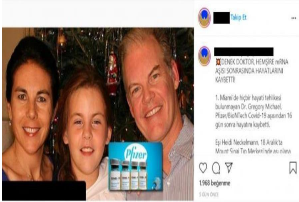
Fotoğraf 3. Aşı Firmalarının COVID-19 Aşısı Yaptıran Doktor Ve Hemşirelerin Hayatını Kaybettiğini Öne Süren Paylaşım ( https://www.dogrulukpayi.com/dogruluk-kontrolu/covid-19-asisinin-yapilmasinin-ardindan-doktor-ve-hemsirelerin-hayatini-kaybettiği-iddiasi adresinden 24.01.2022 tarihinde erişilmiştir.)

Covid-19 aşısına yönelik bir diğer teori ise aşı olan sağlık çalışanlarının hayatlarını kaybettikleri iddiasıdır. Buna yönelik yapılan Instagram paylaşımı aşağıda yer almaktadır.