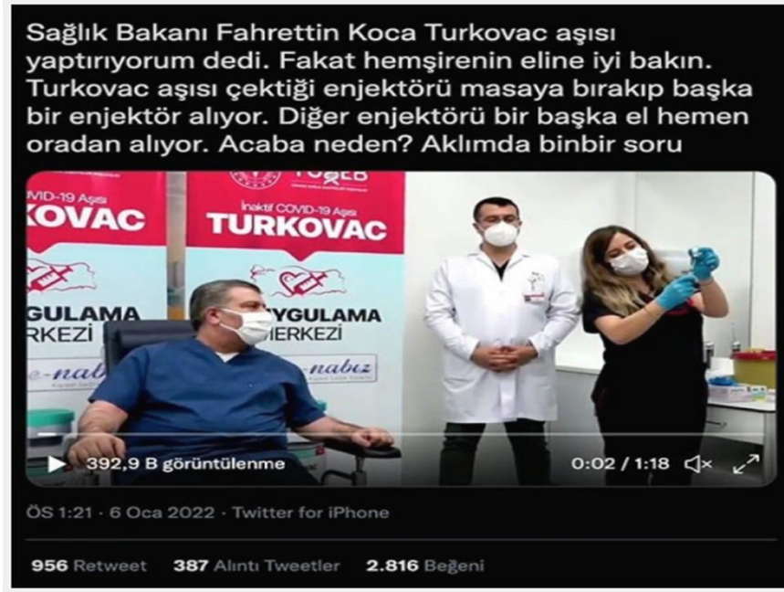
Fotoğraf 4. Fahrettin Koca'nın Turkovac Aşısı Olurken Enjektörü Değiştirildi İddiası (https://www.dogrulukpayi.com/dogruluk-kontrolu/fahrettin-koca-turkovac-olmadi-mi adresinden 24.01.2022 tarihinde erişilmiştir.)

Yine dogrulukpayi.com tarafından analizi gerçekleştirilen bu paylaşım, yanlış olarak değerlendirilmiştir. Ayrıca videonun detaylı izlenilmesi sonucunda enjektörü değiştirilmediği anlaşılmaktadır. dogrulukpayi.com tarafından paylaşımına yönelik yapılan açıklama şu şekildedir: “Bir Twitter hesabı tarafından yapılan paylaşımında Sağlık Bakanı Fahrettin Koca'nın hatırlatıcı dozu Turkovac olmadığı iddia edilmişti. İddiada yer alan videonun tamamı izlendiğinde hemşirenin flakondan enjektöre ilacı çektikten sonra flakonu çekmeceli dolabın üstüne bırakıyor. Başka bir sağlık çalışanı ise flakonu hemen yanında duran soğuk saklama dolabına kaldırıyor. Aşı uygulamalarında prosedür flakondan ilacı enjektöre çekerken daha uzun bir iğne kullanılıyor ve bu işlem tamamlandıktan sonra uzun iğne ucu kısa iğne ucuyla değiştiriliyor. Videonun bir parçası manipüle edilerek paylaşılmış. Hemşirenin flakondan çektiği ilacın Sağlık Bakanı Fahrettin Koca'ya doğrudan uygulandığı net bir şekilde görülüyor.” (www.dogrulukpayi.com).