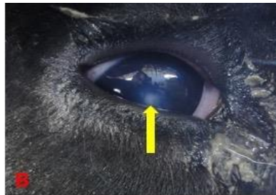
Kornea merkezinde opak alanın görüntüsü