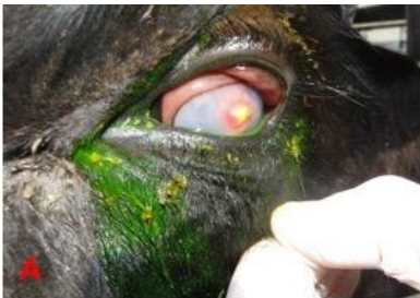
Hasarlı gözlerin fluorescein ile boyanması

Bakteriyolojik etken analizinde hayvanların 5'inde sadece M. bovis , 1'inde hem M. bovis ve hem de E. coli , 1'inde hem M. bovis ve hem de S. aureus , 1'inde hem E. coli ve hem de S. aureus , 1 gözde ise sadece S. aureus izole edildi. Buna karşın 3 gözde ise herhangi bir etken izole edilmedi. Tedaviden sonra yapılan haftalık bakteriyolojik sürüntü örneklerinde herhangi bir etken izole edilmedi.