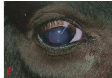
Grup 1-6 no'lu buzağıda tedavi sonrası klinik görünümü