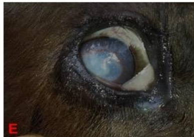
Grup 1-6 no'lu buzağıda tedavi öncesi klinik görünümü