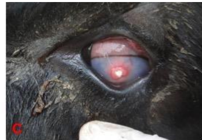
Kornea merkezinde perforasyon (iris prolapsusu)