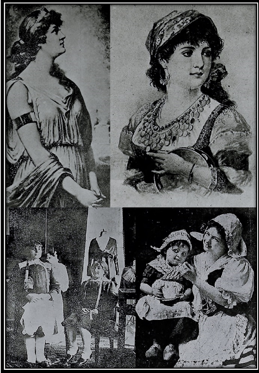
Resim-3. Kadınlık mecmuasının çeşitli sayılarından görseller.