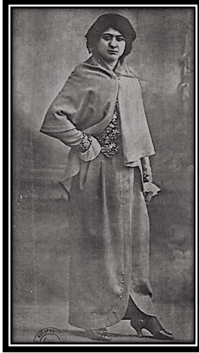
Resim-5. Fatma Aliyye’nin 10 Mayıs 1330 (23 Mayıs 1914) tarihli 10. sayıda kullanılan fotoğrafı.

fotoğrafi aldırarak mümkün değil mi? ” 51 Bu çerçevede kadın giyiminin nasıl olması gerektiğine dair somutlaşmanın önemli örneklerinden bir tanesi 10. sayıda yayımlanan Fatma Aliyye’ye ait fotoğraftır. 3 Nisan 1330 (16 Nisan 1914) tarihli 5. sayıda yayımlanan “ Kısm-ı İctimâ’i: Kadınların Mevki’i ” başlıklı yazıda da kadının nasıl giyinmesi gerektiği üzerinde durulmaktadır. Kadınların eski ve yeni olmak üzere iki kısma ayrıldıklarını söyleyen H.C., doğu kadınının akıldan ziyade sevgi ile irdelenmesinin yanlışlığına dikkat çekmektedir. Yazar, okullar, kitaplar ve fikirler nedeniyle iç görünüş ile dış görünüş arasına sıkışmış yeni bir kadın tipinin ortaya çıktığını belirtmektedir. H. C.’ye göre kadın, vatanperver nesiller yetiştirirken medeni eğitimi modaya uygun elbiseler giymek olarak algılamamalıdır. Türk kadınlarındaki süslenme dürtüsünün Paris kadınlarında bile olmadığını belirten yazar, süslü kıyafetlerin Paris’te ancak toplumsal yaşamda yeri olmayan kadınlar tarafından tercih edildiğini de iddia etmektedir. 52