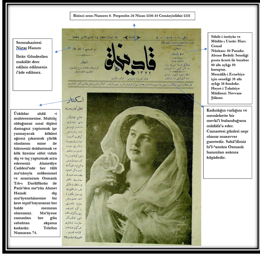
Resim-1. 9 Mayıs 1914 tarihli 8. sayının kapağı.