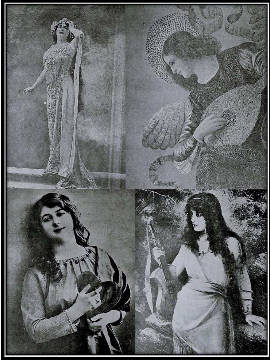
Resim-2. Kadınlık mecmuasının çeşitli sayılarından görseller.

H.C., 3 Mayıs 1330 (16 Mayıs 1914) tarihli 9. sayıda yayımladığı “Kısm-ı İçtimâ’i: Bizde İttihât-ı Nisvân” başlıklı yazısında özgür ruhlu kadınların güzellikler yaratırken taklitçi kadınların ise toplumsal uçurumlara sebep olduklarını iddia etmektedir. Kadınlığın sadece İstanbul ile