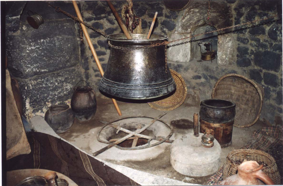
Şekil 1. Tandirevin ocağından bir görünüm

Erzurum evinde odaların boyutları büyük ve yükseklikleri oldukça fazla tutulmuş olup, çok amaçlı orta alan oturma için biçimlenmiş, çevresel alan (makat, seki) kapalı kullanma alanları (yüklekler, sandıklar) ve ısıtma alanı gibi genel düzenlemeleri ile işlev programı olarak Türk odasının tüm özelliklerini yansıtmaktadır. Harem odaları genellikle zemin katta, tandir evine açılır şekilde düzenlenmiştir. Bu odalara “kış odası” da denmektedir. Birinci katta çoğu kez cepheye bir çıkma ile açılan ve baş oda, ayvan oda ya da selamlık diye adlandırılan genellikle de erkek misafirlerin ağırlandığı mekan yer alır. Türk evinde planı belirleyici ve yönlendirici özelliği olan sofa, Erzurum evinde küçülerek sadece bir geçiş alanı olarak işlevlendirilmiştir.