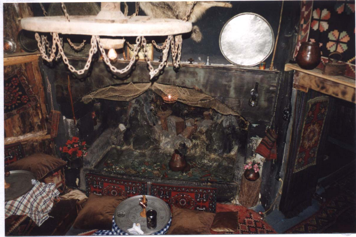
Şekil 4. Tandır yerine günümüzde getirilen bir kullanım şekli

Tarihi bir süreç yaşayarak günümüze kadar gelebilen Erzurum evlerinin gelecek kuşaklara aktarılması sanat ve kültür kimliğinin yok olmaması açısından oldukça önemlidir. Yörede yaşayan halkı tarihsel çevre konusunda bilgilendirmek ve bilinçlendirmek, en önemli uygulama aracı olarak görülmektedir. Tarihi çevrenin planlamasında temel amaç kültürel mirasın korunması, değerlendirilmesi ve gelecek kuşaklara iletilmesidir.