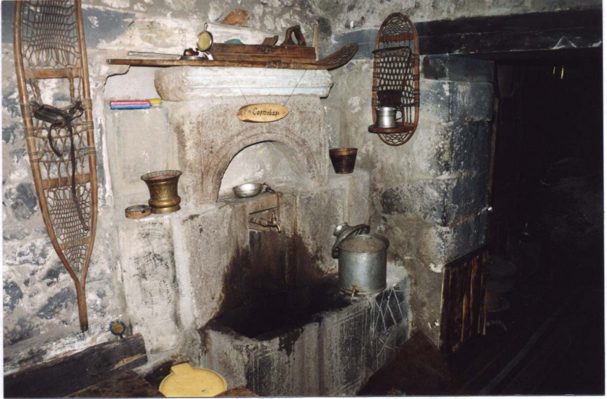
Şekil 2. İç mekanda kullanılan çeşme

Oda tavanlarında, yüklük ve çiçekliklerde, dolap ve kapı kanatlarında, pencere aynalıklarında gerek motif ve gerekse teknik bakımından çok zengin örnekler mevcuttur. Kapıların Z biçimli kuşaklarına çakılan top başlıklı çiviler kanatlara bir çekicilik kazandırır. Madeni süslemelere, kapılarda, ahşap kiriş bağlantılarında, pencere parmaklıklarında rastlanmaktadır. Kapı kanatlarını tutan büyük başlı dövme çiviler ve kapı tokmakları Erzurum evleri dış süslemesinde önemli yere sahip unsurlardır. Kapı tokmakları halka, hilal, oval biçimli olduğu gibi bazen de el biçimli olduğu belirlenmiştir. Bazı kapı kanatlarında eve gelen ziyaretçilerin bay veya bayan olduğunu çıkarttığı farklı seslerden anlaşıldığı bir nevi cinsiyet belirleyici kapı tokmakları Erzurum evlerinde görülen otantik tasarımlardan biridir (Karpuz,1993).