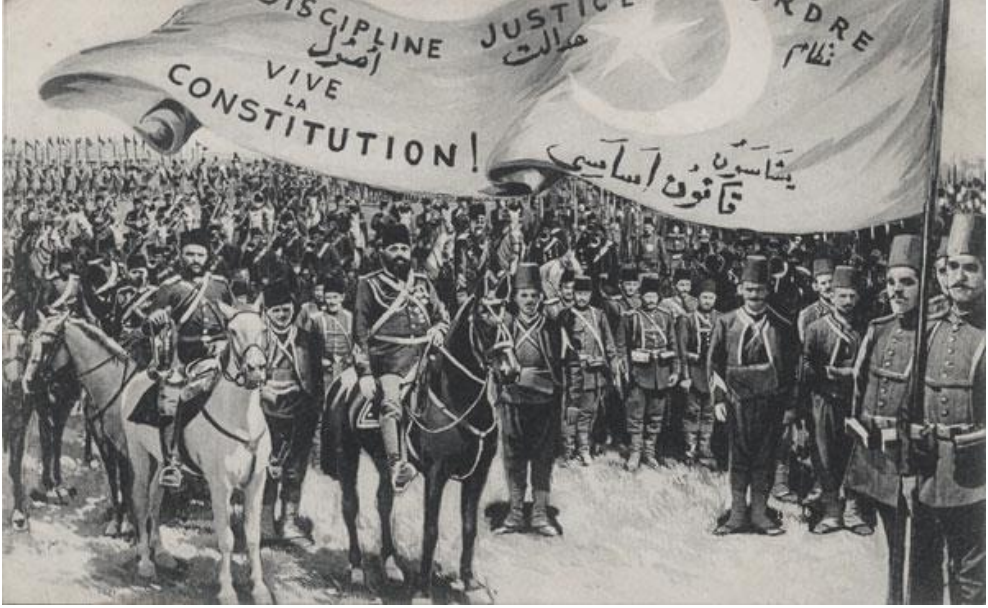
Ek-1: II. Meşrutiyet'in İlanı ( http://devlet.com.tr/makaleler , Erişim Tarihi: 26.05.2020)