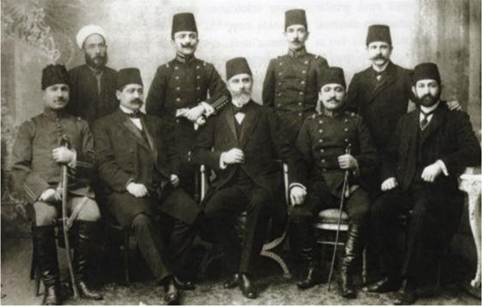
Ek-3: İttihat ve Terakki'nin Önemli İsimleri Bir Arada