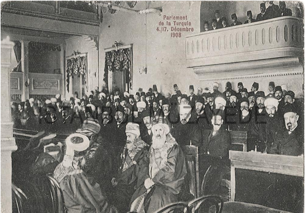
Ek-2: II. Meşrutiyet Parlamentosu