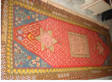
Kilimin genel fotoğrafı