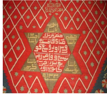
Kilimdeki Mührü Süleyman