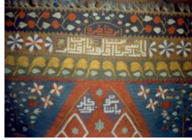
Başka bir görünüm