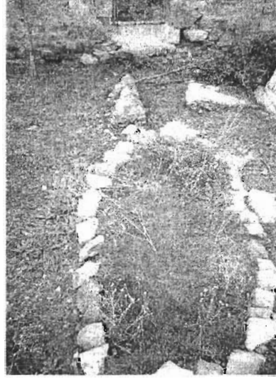
Resim 2: Zihni'nin Mezarından Bir Görünüm