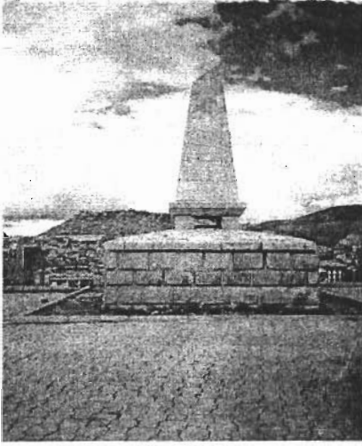
Resim 1: Zihni'nin Mezarının Bulunduğu İmaret Tepesindeki Anıt - Bayburt.