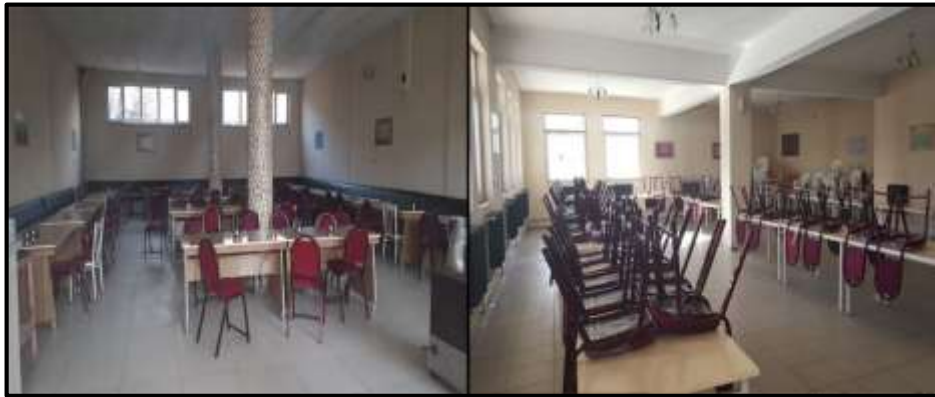
Fotoğraf 4. Taziye evlerinde iç mekân çoğunlukla çok sayıda misafiri ağırlayacak şekilde sandalye ve masalarla donanmış durumdadır.

Şehirdeki taziye evlerinin önemli özelliklerinden bazıları da iç mekân özellikleri olarak sıralanabilir. İncelenen taziye evlerinin hemen hepsinde benzer iç mekân özellikleri ile karşılaşmış olup masa ve sandalyelerden oluşan genel bir sadelik ilk göze çarpan özellik olmuştur (Fotoğraf 4). Genellikle kare veya dikdörtgen plânlı olan taziye evlerinin ortalama 80-100 kişi kapasiteli olduğu görülmektedir. Taziye evlerindeki masa ve sandalye sayısının fazlalığı hem gelen çok sayıda misafiri ağırlama ihtiyacına yönelik olarak tasarlanmakta hem de çay ve yemek gibi çeşitli ikramların sunulabilmesine olanak sağlamaktadır. Taziye evlerinin aynı amaçlara yönelik olarak mümkün olduğunca geniş tutulmasına ve oda oda ayrılmak yerine herkesin birbirini ve cenaze sahiplerini görerek yapılacak ortak dualara katılabileceği bir görünüme kavuşturulmasına özen gösterildiği gözlenmiştir. Bu nedenle eldeki imkânlarla, bütçeye ve ayrılabilen alana göre değişmekle birlikte şehirdeki taziye evlerinde geniş, ferah ve sade bir görünümün oluşturulmaya çalışıldığı ifade edilebilir.