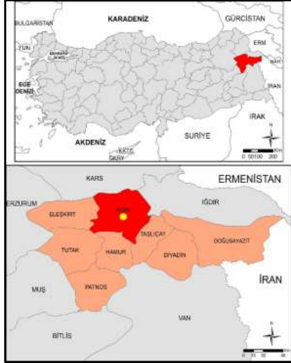
Şekil 1. Ağrı şehrinin konum haritası.

Ağrı, ülkemizin doğusunda Doğu Anadolu Bölgesi'nin Yukarı Murat-Van Bölümü'nde yer almaktadır. İl topraklarının kuzeyinde Iğdır ve Kars, güneyinde Van ve Bitlis, batısında Erzurum, güneybatısında Muş ve doğusunda ise İran yer almaktadır (Şekil 1). Yüzölçümü büyüklüğü 11.099 km 2 olan Ağrı ilinin toplam nüfusu 2018 yılında 539.657 kişidir (Tablo 1).