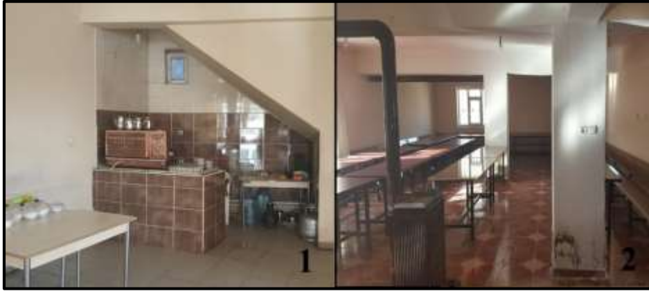
Fotoğraf 5. Yiyecek-içecek servisinin hazırlandığı mutfak bölümleri (1) ve kış aylarında ısınma amaçlı kullanılan sobalar (2), taziye evlerinin vazgeçilmez donatıları arasında sayılabilir.

Taziye evlerinde görülen ortak özelliklerden bir diğeri ise hemen her taziye evinin vazgeçilmezi olan sobalar ve mutfak bölümleri olarak belirtilebilir (Fotoğraf 5). Ağır kış şartlarının hâkim olduğu Ağrı şehrinde sobaların taziye evleri için tercihten ziyade bir zorunluluk olduğu muhakkaktır. Yapılan gözlem ve incelemelerde taziye evlerini ısıtabilecek nitelikte büyük sobaların tercih edildiği ve yer yer birden fazla sobanın da kullanılabilirdiği görülmüştür. Ancak yapılan görüşmelerde taziye evlerinde kış aylarının vazgeçilmezi olan sobaların yakacak ihtiyacının ve kullanımlarının başlı başına birer sorun olduğu da belirtilmiştir. Misafirlere sunulacak çay, yemek vb. ikramların hazırlanabilmesi için gerekli olan mutfak bölümleri de taziye evlerinin bir başka önemli ortak özelliğini oluşturmaktadır. Bazılarında sadece bir ocak bölümü ya da çay kazanı bulunan bazılarında ise meşrubatlar için buzdolabı, gerek görüldüğünde kullanılacak raflar, tencere, tava, tabak, kaşık, çatal, bardak vb. mutfak eşyalarının da bulunduğu oldukça donanımlı mutfak örnekleri görülmektedir. Yapılan görüşmelerde malzeme eksikleri olan bazı taziye evlerinde cenaze sahiplerinin ya da komşu ve akrabaların geçici olarak bu eksikleri tamamladığı yer yer de hayır sahiplerinin bu tür eksikleri kendi imkânlarıyla tamamlayarak söz konusu sorunları çözebildikleri ifade edilmiştir.