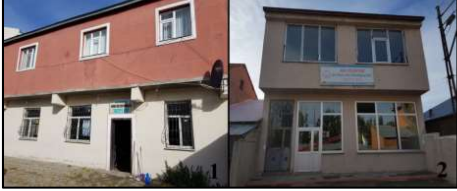
Fotoğraf 3. Taziye evlerinin bir kısmı Ağrı Belediyesi tarafından hizmete açılmıştır (M.Akif Ersoy [1] ve Alpaslan mahalleleri [2] taziye evleri).

Şehirdeki taziye evlerinin önemli özelliklerinden bazıları da iç mekân özellikleri olarak sıralanabilir. İncelenen taziye evlerinin hemen hepsinde benzer iç mekân özellikleri ile karşılaşmış olup masa ve sandalyelerden oluşan genel bir sadelik ilk göze çarpan özellik olmuştur (Fotoğraf 4). Genellikle kare veya dikdörtgen plânlı olan taziye evlerinin ortalama 80-100 kişi kapasiteli olduğu görülmektedir. Taziye evlerindeki masa ve sandalye sayısının fazlalığı hem gelen çok sayıda misafiri ağırlama ihtiyacına yönelik olarak tasarlanmakta hem de çay ve yemek gibi çeşitli ikramların sunulabilmesine olanak sağlamaktadır. Taziye evlerinin aynı amaçlara yönelik olarak mümkün olduğunca geniş tutulmasına ve oda oda ayrılmak yerine herkesin birbirini ve cenaze sahiplerini görerek yapılacak ortak dualara katılabileceği bir görünüme kavuşturulmasına özen gösterildiği gözlenmiştir. Bu nedenle eldeki imkânlarla, bütçeye ve ayrılabilen alana göre değişmekle birlikte şehirdeki taziye evlerinde geniş, ferah ve sade bir görünümün oluşturulmaya çalışıldığı ifade edilebilir.