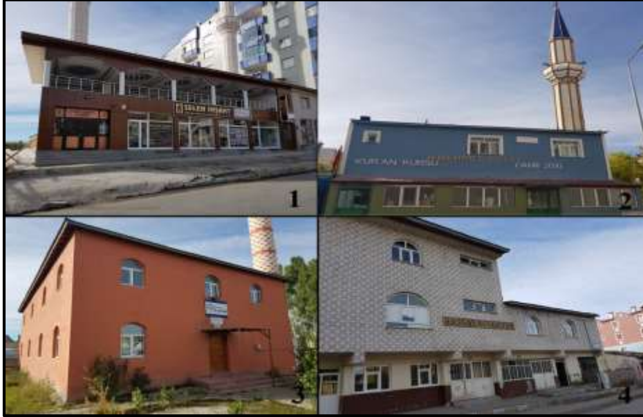
Fotoğraf 2. Şehirdeki taziye evlerinin büyük bölümü camilerin yanında veya yakınında yer almaktadır (1- Dede Murat Camii ve Taziye Evi, 2-H. Mehmet Polat Camii ve Taziye Evi, 3- Hz.Aişe Camii ve Taziye Evi, 4- Kerim Yıldız Camii ve Taziye Evi).