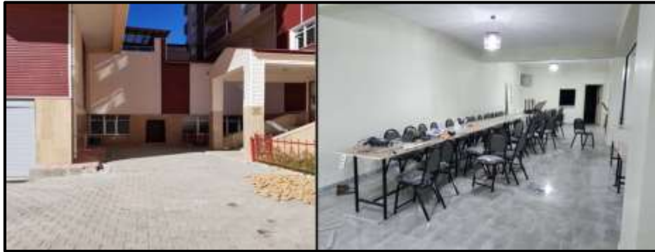
Fotoğraf 7. Ağrı'da yer alan apartman ve sitelerin ortak kullanım alanlarının da taziye evi olarak kullanıldığı görülmektedir.

Saha çalışmaları sırasında dikkat çeken yeni bir uygulama ise apartman veya sitelerin ortak kullanım alanlarında taziye evi oluşturulması olarak gözlemlenmiştir (Fotoğraf 7). Fırat Mahallesi'nde gözlemlenen bu tür örneklerin (18 ve 19 numaralı taziye evleri-Şekil 2) tam sayısını tespit etmek pek mümkün olmamakla beraber artan şehirleşme ve apartman hayatına paralel olarak bu uygulamanın kısa zamanda yaygınlaşacağını tahmin etmek mümkündür. Apartman dairelerinin taziyeler esnasında kalabalık misafir gruplarını ağırlamak için yeterli büyüklükte olmayışı ve geleneksel gerekçelerle kadın ve erkeklerin aynı mekânda taziye ziyareti gerçekleştirememeleri gibi nedenlerle şehirde bu tür taziye evlerinin giderek önem kazanacağı ifade edilebilir. Bu uygulamanın bir başka olumlu özelliği ise site veya apartman sakinlerinin taziyeleri dışında toplantılar, yemekler ve benzer toplu etkinlikler için de kullanılabilir fonksiyonel bir kullanım alanının oluşturulmuş olmasıdır.