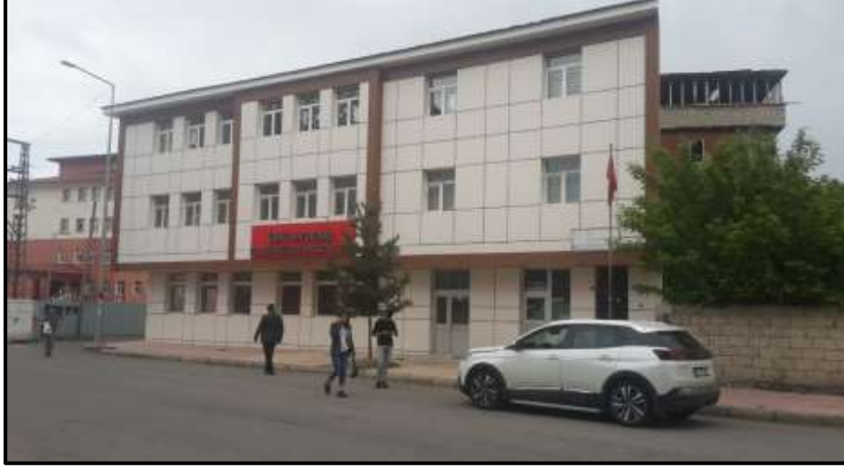
Fotoğraf 1. Şehirdeki çok sayıda taziye evi Kur'an kursları ile birlikte hizmet vermektedir. Bunlardan birisi olan Zeki Aydemir Taziye Evi ve Fatma Aydemir Kur'an kursu (Fatih Mahallesi).