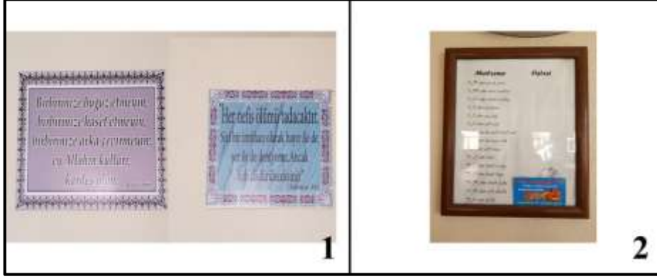
Fotoğraf 6. Taziye evlerinin duvarlarında, ölümü hatırlatan ve erdemli yaşamı tavsiye eden ayet ve hadislerin yanı sıra (1), mevcut malzemelerin listelendiği tablolarla da (2) karşılaşılabilmektedir.

Saha çalışmaları sırasında dikkat çeken yeni bir uygulama ise apartman veya sitelerin ortak kullanım alanlarında taziye evi oluşturulması olarak gözlemlenmiştir (Fotoğraf 7). Fırat Mahallesi'nde gözlemlenen bu tür örneklerin (18 ve 19 numaralı taziye evleri-Şekil 2) tam sayısını tespit etmek pek mümkün olmamakla beraber artan şehirleşme ve apartman hayatına paralel olarak bu uygulamanın kısa zamanda yaygınlaşacağını tahmin etmek mümkündür. Apartman dairelerinin taziyeler esnasında kalabalık misafir gruplarını ağırlamak için yeterli büyüklükte olmayışı ve geleneksel gerekçelerle kadın ve erkeklerin aynı mekânda taziye ziyareti gerçekleştirememeleri gibi nedenlerle şehirde bu tür taziye evlerinin giderek önem kazanacağı ifade edilebilir. Bu uygulamanın bir başka olumlu özelliği ise site veya apartman sakinlerinin taziyeleri dışında toplantılar, yemekler ve benzer toplu etkinlikler için de kullanılabilir fonksiyonel bir kullanım alanının oluşturulmuş olmasıdır.