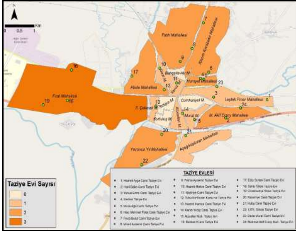
Şekil 2. Ağrı şehrinde incelenen taziye evlerinin mahallelere göre dağılışı (2018).

(Fotoğraf 1 ve 2). Bu durumun en önemli sebeplerinden birisinin taziye ve ölümün dinî ritüeller barındırması olduğu düşünülebilir. Gerçekten de taziye evleri cenaze sahiplerine manevi destek için biraraya gelinen yerler olmalarının yanı sıra ölen kişi için dualar edilen ve bu yönüyle de dinî bir yapı üzerine inşa edilmiş toplumsal mekânlardır. Bu nedenle Cami ve Kur'an kurslarıyla aynı mekânları paylaşmaları da şaşırtıcı değildir. Taziye evlerinin yapımında ise genellikle belediye gibi kamu kaynaklarının kullanıldığı (Fotoğraf 3) veya hayır sahiplerinin etkili olduğu ya da ortaklaşa oluşturulan bir bütçe ile yaptırıldıkları görülmektedir. Saha gözlemlerinde şehirde her üç uygulamaya ilişkin örneklerin de bulunduğu gözlenmiş olup aslında bu uygulamalar taziye evlerinin ne kadar önemli bir toplumsal ihtiyaç olduğunu da göstermektedir. Artan şehirleşme ile giderek küçülen mesken alanlarının da zamanla taziye evlerine olan ihtiyacı artıracığını öngörmek de mümkündür.