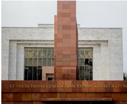
Foto 6: Kırgızca: Vahşi şahini kuş yaptım, dağılmış milleti halk yaptım