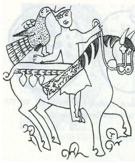
R3 Ural bölgesinde bulunmuş, 9 ve 10. yy.lara ait bir gümüş tastaki atlı doğancı tasviri.