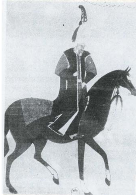
R4 Yaklaşık olarak 1566 ya tarihlendirilen ve Kanuni Sultan Süleyman'ı at üstünde tasvir eden bir Osmanlı minyatürü.