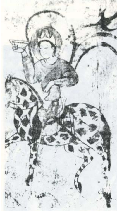
R6 Hotan'daki 8.yy'a ait buluntulardan birisi.