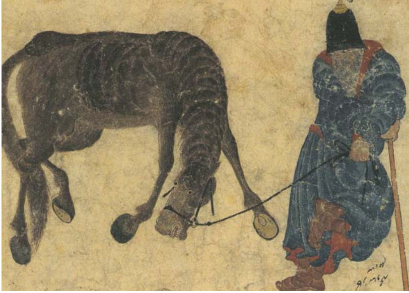
R9 Atını otlatan Yörük (25,5 x 16,3). TSM, Hazine, 2153, s. 84a.