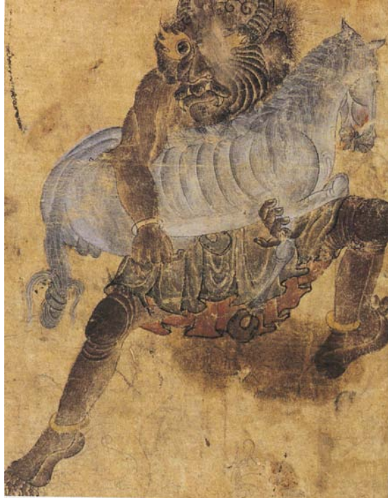
R8 At kaçıran demon (15,3 x 19,6). TSM, Hazine, 2153, s. 38a.