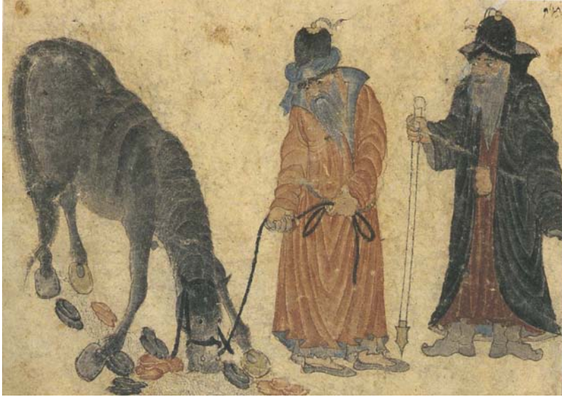
R10 Ot arayan at ve Yörükler (26,4 x 16,7). TSM, H, 2153, s. 113a.