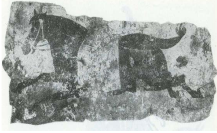
R7 Turfan'da bulunmuş, dörtnala koşan yağız bir süvari atını gösteren Uygur resmi.