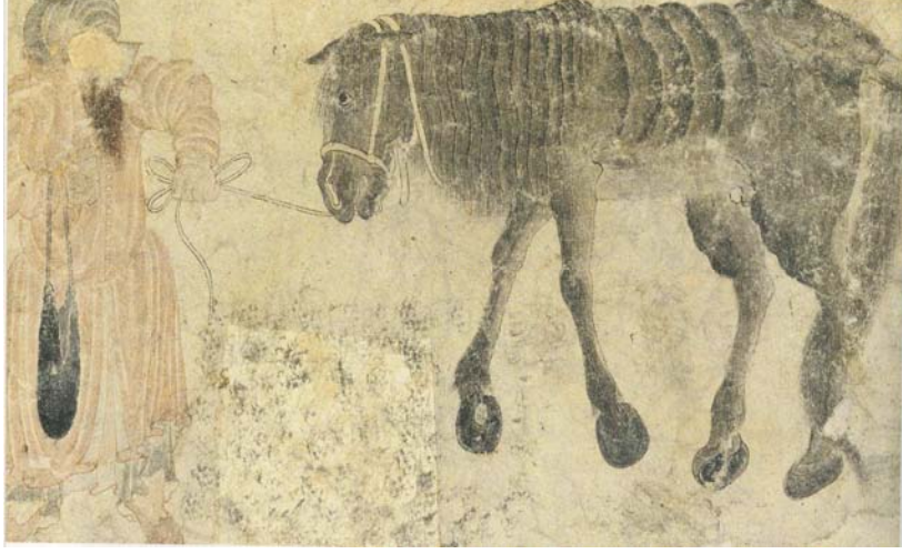
R11 Atını yularından çeken Yörük (25 x 13,6). TSM, Hazine, 2153, s.118b