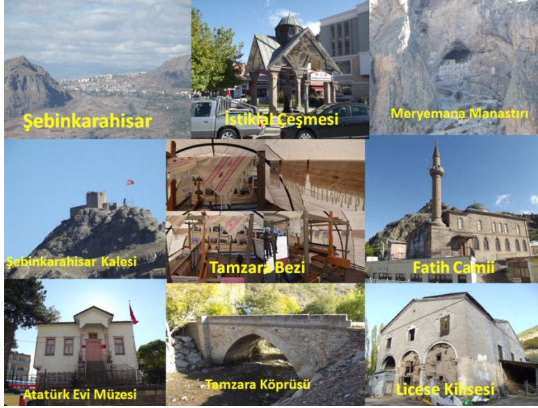
Fotoğraf 1. Şebinkarahisar ilçesindeki tarihi ve kültürel çekiciliklerden görünümüler.