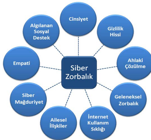
Şekil 2. Siber Zorbalıkla İlişkili Değişkenler

Bu çalışmanın ilk araştırma sorusu “Siber zorbalıkla ilgili yapılan çalışmalarda siber zorbalıkla ilişkili hangi değişkenler tespit edilmiştir?” şeklinde belirlenmiştir. Bu soruya yanıt bulmak üzere gerçekleştirilen alanyazın incelemesi sonucunda siber zorbalıkla ilgili olarak çok sayıda değişkenin ortaya çıktığı görülmektedir. Bu bağlamda “Cinsiyet, Gizlilik Hissi, Ahlaki Çözülme, Geleneksel Zorbalık, İnternet Kullanım Sıklığı, Ailesel İlişkiler, Siber Mağduriyet, Empati ve Algılanan Sosyal Destek” gibi değişkenlerin öne çıktığı anlaşılmaktadır.