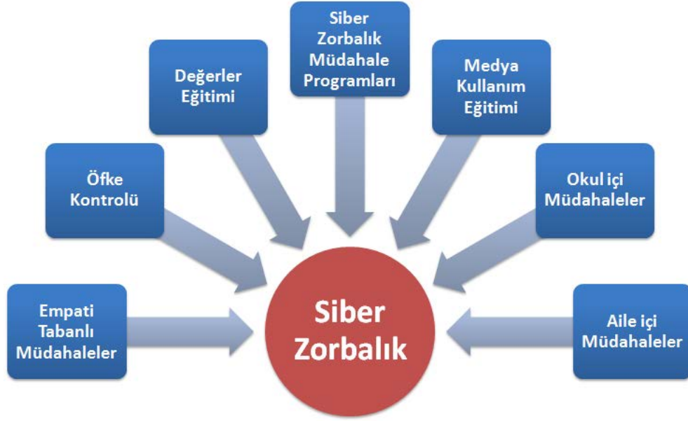
Şekil 3. Siber Zorbalıkla İlgili Çözüm Önerileri