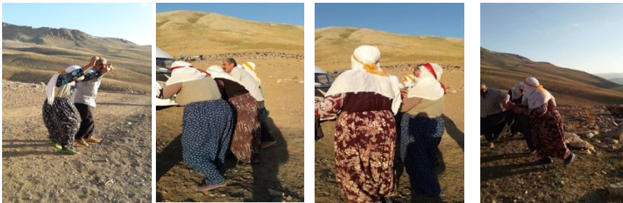
Fotoğraf 7: Yayladan Eve Dönüş Öncesi. İşlerini Bitirip Halay Çeken Kadınlar.

Kadının peynir yapımı ile odak noktasında yer aldığı bu yayla rutini kadınlar açısından son derece zor ve emek gerektirmesine rağmen bir o kadar keyifli anların paylaşıldığı, gülünüp-eğlenilen bir yaşam pratiğine dönüşmüş durumdadır (Fotoğraf 7).