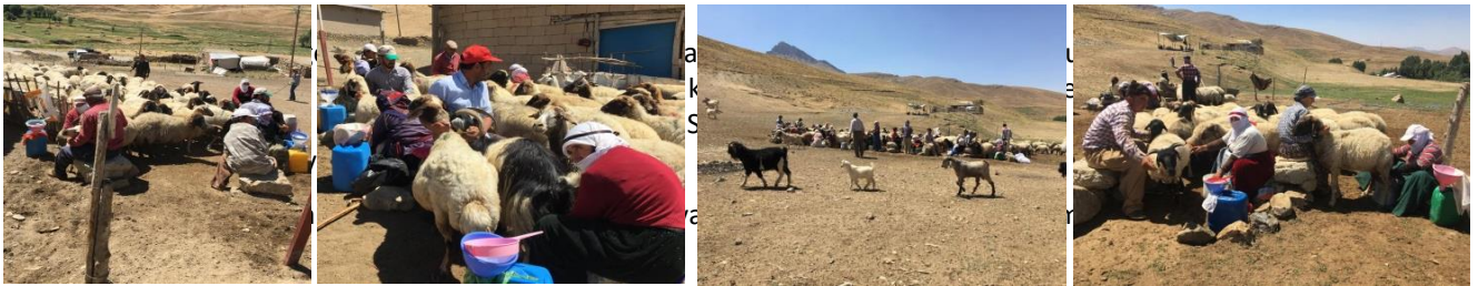
Fotoğraf 1: Köy Meydanında Sağım Yapan Kadınlar

Köyde sağım yapan katılımcılar için de benzer zorluklar olmasına rağmen uzun yolculuk yapılmaması ve evdeki olanaklar nedeniyle daha kolay ve hijyenik bir süreç yaşandığı gözlenmiştir.