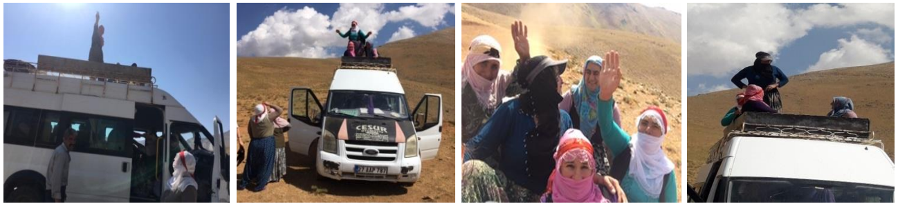
Fotoğraf 3: Çatak-Görentaş-Badilhali Yaylasına Gidiş-Dönüş Yolculuğu

Yaylada peynir yapım süreci yaylaya doğru erken saatlerde başlayan uzun ve meşakkatli bir yolculuk sonrası (bir saat) başlamaktadır (Fotoğraf 3).