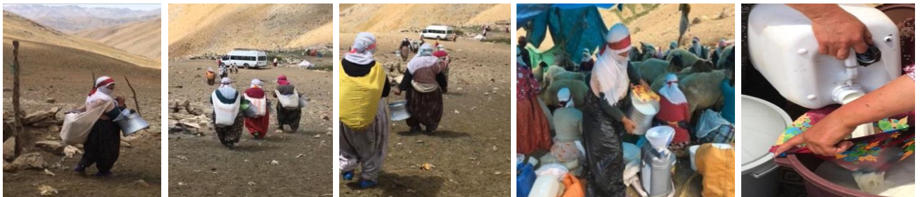
Fotoğraf 5: Van-Çatak İlçesi-Görentaş Köyü-Badilhali Yaylası. Süt Sağımı Sonrası Sütü Sırtında Taşıyan Kadınlar

Genellikle VOP üretimimin orta yaş üstü kadınlar tarafından sürdürülmekte olduğu görülmüştür. Bunun nedeni sorulduğunda, son yıllarda genç kadınların evlendikten sonra genellikle şehre yerleşmeleri ve köyde yaşayanların ise genellikle yaylaya gelmeyip ev işleri ve çocuklar ile ilgilendiklerini belirtmiştir. Kadınlar, peynir işi ile birlikte ev-içi işleri yürütmenin kırsalda kadını çok yordduğundan bahsetmişlerdir. Bu nedenlerle, kadınlar kızlarını evlendirecekleri zaman çoğunlukla “şehirde ev serilmesi(ev kurulması)” isteğinde bulunmaktadırlar. Eğer damat tarafı kabul etmezse kızı vermeme noktasına bile gelmektedir. Kırsalda yaşayan kadının bu isteği, kızının da kendisi gibi yorulup, eziyet çekmemesini istemesinden kaynaklanmaktadır.