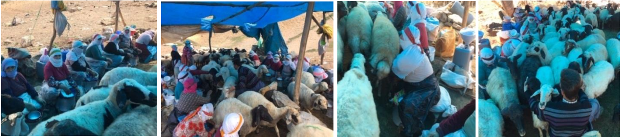
Fotoğraf 4: Yaylada Sağım Sırasında Oturma Düzeni ve Koçbaşlığı Yapan Çoban

Kadınlar yaylaya ulaştıktan sonra sağım hazırlıklarını tamamlayarak geleneksel olarak belirlenmiş oturma düzeninde oturarak, çobanlar tarafından sağım alanına getirilen hayvanlarını sağmak üzere beklemektedirler (Fotoğraf 4). Sağılan sütler daha sonra çadır bölgesine taşınarak peynir yapımı gerçekleştirilmektedir (Fotoğraf 5).