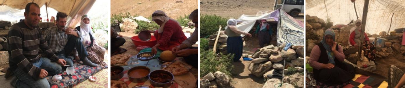
Fotoğraf 6: Yaylada Kadınların Dinlenme Çadırlardan Görünümler.

Yaylada peynir yapan kadınlar, ilk sağım sonrası peynir yapımı ve temizlik vs. gibi diğer işleri bittikten sonra kendilerine ait çadırlara dinlenmek veya ibadet etmek amacıyla çekilmektedirler. Yaylada her kadına ait bezlerden yapılmış çadırlar bulunmaktadır. Çadırlar yemek yeme, ibadet etmek ve dinlenmek için kullanılmaktadır. Yaşlı kadınlar genellikle uyuyarak dinlenmeyi tercih etmekte, genç kadınlar ise toplanıp çay içip sohbet etmektedirler (Fotoğraf 6).