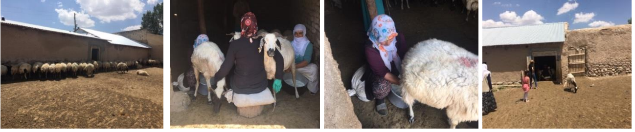
Fotoğraf 2: Köyde Ahırlarda Günlük Sağım ve Koçbaşlığı Yapan Kadınlar

“Bir öğün sağıyoruz. Her evin ayrı çobanı var. Gün boyunca koyunlar otlatılıyor. Getirilip sağımı yapıyor. Sonra tüm koyunlar birleştirilip götürülüyor.” (Ö.K.1)