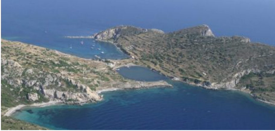
Fotoğraf 7. Datça Yarımadası'nın Tekir Burnu'nda Knidos tombolusu.

Knidos, önce bugünkü Datça İskelesi'nin yaklaşık 1.5-2 km kuzeyinde, Dalacak Burnu ve Burgaz Düzlüğü'nde kurulmuştu. Tarıma dayalı gelişme gösteren şehir, bir süre sonra, deniz ulaşımı bakımından daha elverişli bir konumda olan, Datça Yarımadası'nın batı ucundaki Tekir Burnu'na taşınmıştır. Ancak bu yer değişikliğinden sonra da Eski Knidos tarımsal etkinliğini sürdürmüştür ve önemini uzun bir süre daha korumuştur (Kayan, 1988;52).