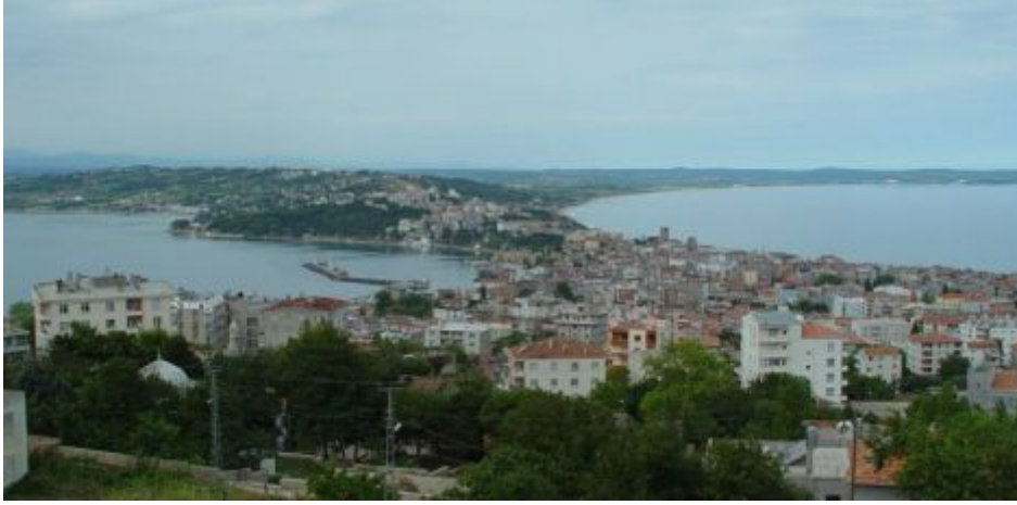
Fotoğraf 1. Hıdırlık Tepe'den Sinop ve tombolo sahasının görünüşü.

Güney Karadeniz'de, doğal limanı olmayan bir kıyıda, tombolo ile oluşan Sinop Yarımadası'nın konumu ve özellikleri gemicilerin dikkatlerini çekmişti. Yunanlılar daha Karadeniz'e gelmeden çok öncede, Fenikeliler bu kıyıya gelerek Asurlularla alış-veriş yapıyorlardı (Texier, 2002;3/209). Tarihi süreç içinde, Roma, Bizans, Selçuklu ve Osmanlı gibi birçok medeniyete tanıklık eden Sinop, 19. yüzyılın ilk yarısında bir sancak merkezi ve Karadeniz seferlerini yapan buharlı gemilerin de başlıca istasyonuydu. Günümüzde ise Sinop, 36734 nüfuslu il merkezi bir şehir olup önemli bir liman özelliğini sürdürmektedir (Fotoğraf 1).