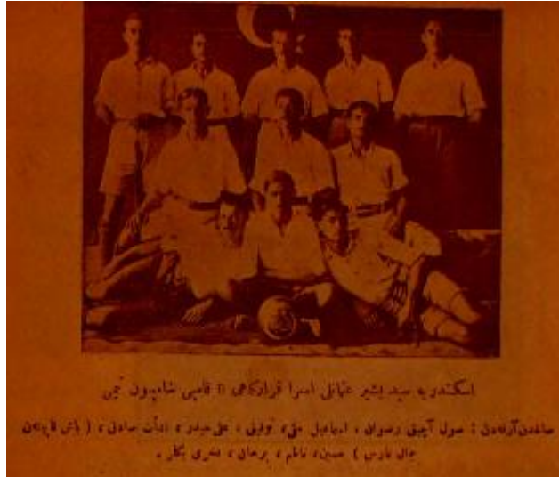
Fotoğraf 6: İskenderiye Seydibeşir Osmanlı Üsera Karargâhı B Kampı Şampiyon Timi

İşte bu gayretler çok şükür memlekete, esir düşen evlatlarının ömürlerinin tembellikle geçmesine mani, sağlam birer vücutla dönmelerine sebep oldu.