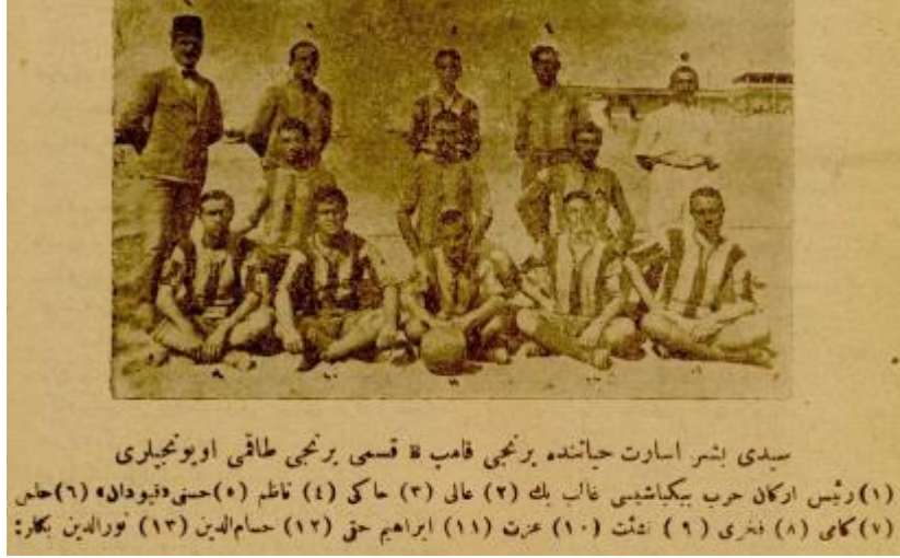
Fotoğraf 5: Seydibeşir Üsera Hayatında Birinci Kamp B Kısmı Birinci Takımı Oyuncuları

yazmış!...” gibi sözlerle zavallı zabitan her şeyde olduğu gibi bunu da zaman zaman bekletiler. Gözleri kampın tel örgülü, hemen büyük bir merasimle açılan kapısının her sabahki küşadına ve eşya almak üzere giden heyetin dönüşüne muntazırdılar. Zavallılar.