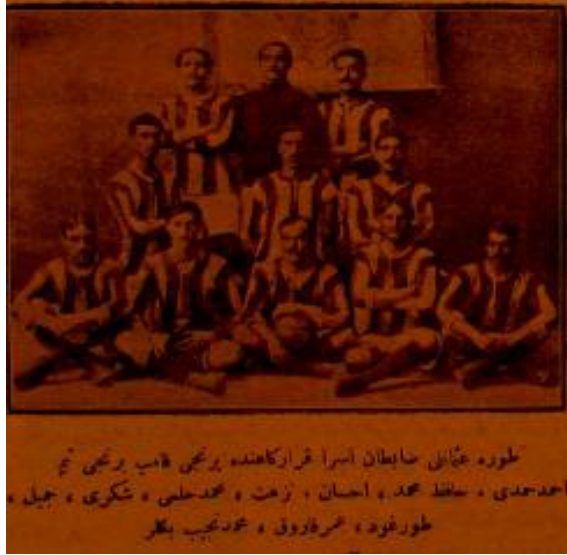
Fotoğraf 4: Tura Osmanlı Zabitan Üsera Karargâhında Birinci Kamp Birinci Tim

Bu fikir, orada yoksuzluk, iaşe, idare gibi düşüncelere rağmen memleketin istikbaldeki her hangi bir vaziyetinin, umumi ve hususi yaşamlarının her halde sağlam vücutlara hastalıktan, keyifsizlikten hissesi olmayan veya nispeten az bulunan salim bir düşünceye ihtiyacı olduğunu takdir ettirdiği için, muhitin de mecburiyeti pek çok temeller üzerine yerleşti. Bu halde genç zabitan efendiler teşebbüs ederken kendilerinden büyük rütbeli zabitan beylerden teşvik, himaye, muavenet gördüler. Yalnız idman hususunda değil, mühim işlerde gençliğe pek büyük fedakârlık etmiş olan bu zevat-ı kiramin pek çok adetlere yükseldiğini iftiharlarla şuracıkta zikretmeyi bir borç, bir şükran bilirken, mümkün mertebe sırası geldikçe muhterem isimlerini de sade meslektaşlara değil vatana, şu memleketin tarih-i hazinine arz etmek isterim.