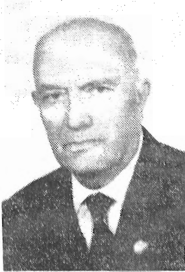
VEHBİ CEM AŞKUN