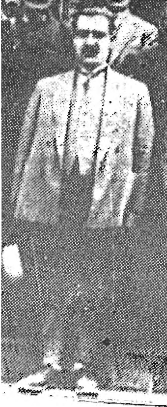
CUMHURİYETİN İLK YILLARINDA CEMAL BEY