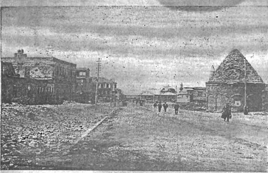
Erzurumda Yeni bir Cadde