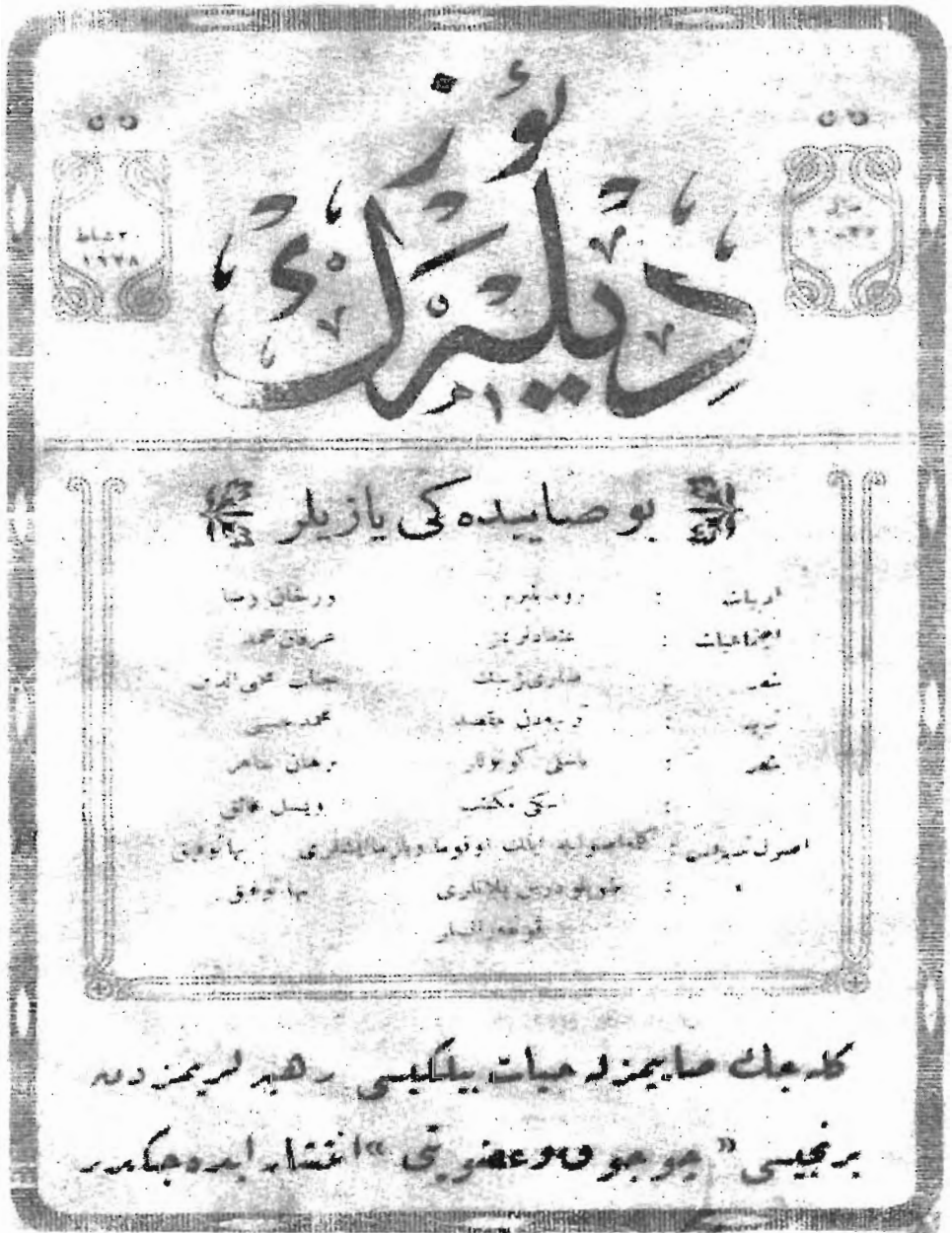
CEMAL GÜLTEKİN'İN YAYINLADIĞI 2 ŞUBAT 1928 TARİHLİ 10-25 SAYILI ÖRNEĞİ. TRABZON İKBAL BASIMEVİ