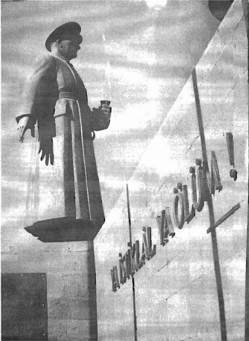
ERZURUM'DA HAVUZ BAŞINDAKİ ATATÜRK HEYKELİ