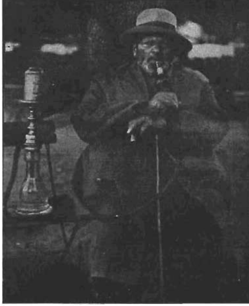
Korukcuzâde Rıza Bey