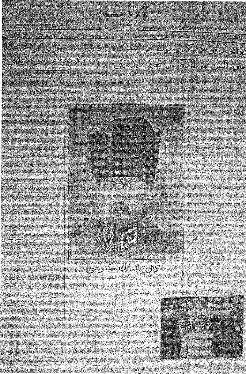
Ek 1: Birlik Gazetesinin Bir Nüshasının Baş Sayfası