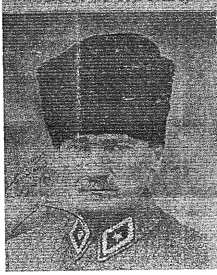
Ek 2: Atatürk'ün Türk Teavün Cemiyeti'ne Hediye Ettiği İmzalı Fotoğrafı