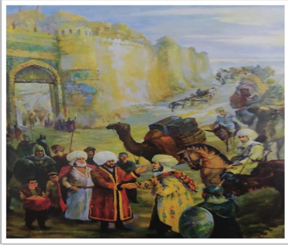
Ek 4: Kadim Şehrin Dükkanları (s. 275)