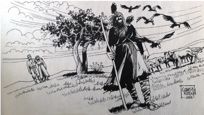
Resim 3. Deligüçük Karakteri (Cantek ve Kuzgun, 2009: 23)

Deligüçük yedi kargasıyla dolaşan (ve kimi zaman konuşan), iri, simsiyah uzun saç ve sakalı olan, üzerinde hiç çıkarmadığı kaba siyah gocuğu, ayaklarında urganlarla bağlanarak sağlamlaştırdığı çizmeleri, keskin ve kayaları dahi un ufak edebilecek sertlikli bakışları ve elinden hiç düşürmediği uzun değneğiyle 19. yüzyıl Osmanlı taşrasında zulme uğrayan herkesin yardımına koşan bir kahramandır. İhtiyaç olan her yerde ve her durumda ortaya çıkması, onun ayrıca insan üstü bir varlık olarak algılanmasını da sağlamaktadır.