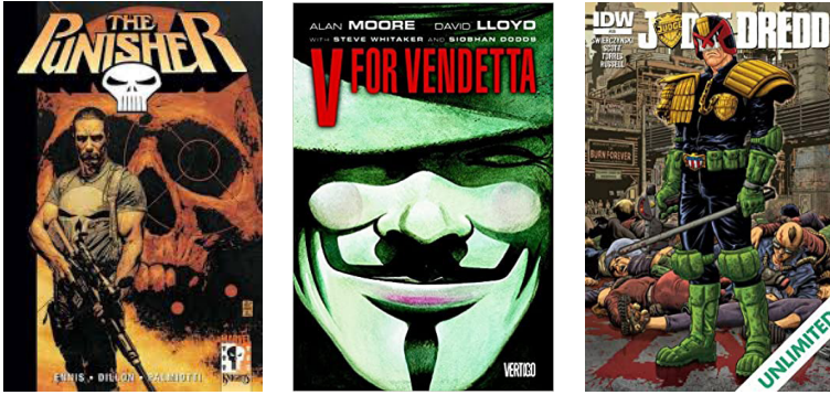
Resim 1. Punisher, V for Vendetta ve Judge Dredd çizgi romanları (Bağlantı 1, 2 ve 3)

Yukarıda verilen en bilindik iki örnekte olduğu gibi, dünyanın çizgi roman okunan her köşesinde adalet misyonuyla yaratılmış olan karakterlerin suçla savaşmada kendi yöntemleri olduğu görülmektedir. Örneğin Red Kit, Tex Willer, Tenten, Tom Miiks veya Spider-Man suçla savaşırken şiddet uygulamasalar bile suçluyu asla öldürmeden adalete teslim etmekte, ancak V for Vendetta taki “V” karakteri, Punisher veya Judge Dredd gibi karakterler suçluyu önce yargılayıp sonrasında adaleti sağlamak uğruna onları kolayca öldürebilmektedirler.