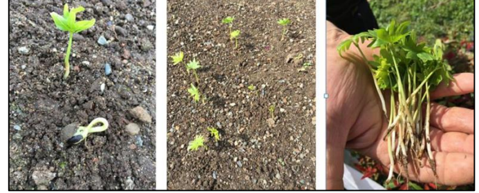
Şekil 2. Ekim yastıklarında tespit edilen çimlenmeler ve fidecik sayımı

edilmiştir (Şekil 2). Çimlenmelerdeki düzensiz ve orantısız duruma bağlı Şubat-Mayıs dönemi içerisinde birinci sayım ile ikinci sayım arasında 17 gün, ikinci sayımla üçüncü sayım arasında 14 gün, üçüncü sayımla dördüncü sayım ve dördüncü sayım ile beşinci sayım arasında 10 gün, diğer sayımlar arasında ise 7 gün olacak şekilde 100 günlük bir dönem içinde çimlenme sayımları gerçekleştirilmiştir.