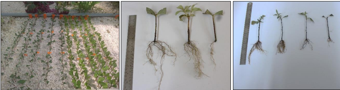
Şekil 1. Köklendirme ortamına aktarılan ve sökülen çeliklere ilişkin görseller

Elde edilen veriler önce SPSS 22 (SPSS Inc) istatistik programı yardımıyla varyans analizine tabi tutulmuş olup, sera ortamları ve hormonlar açısından meydana gelen gruplar Duncan testi ile belirlenmiştir.