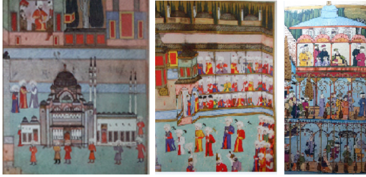
Fig.3 Surname-i Hümayun da Mimar Sinan'ın temsili olarak eserini taşıyan grup. Atasoy, Nurhan. 1997. Surname-i Humayun , İstanbul: Koçbank.