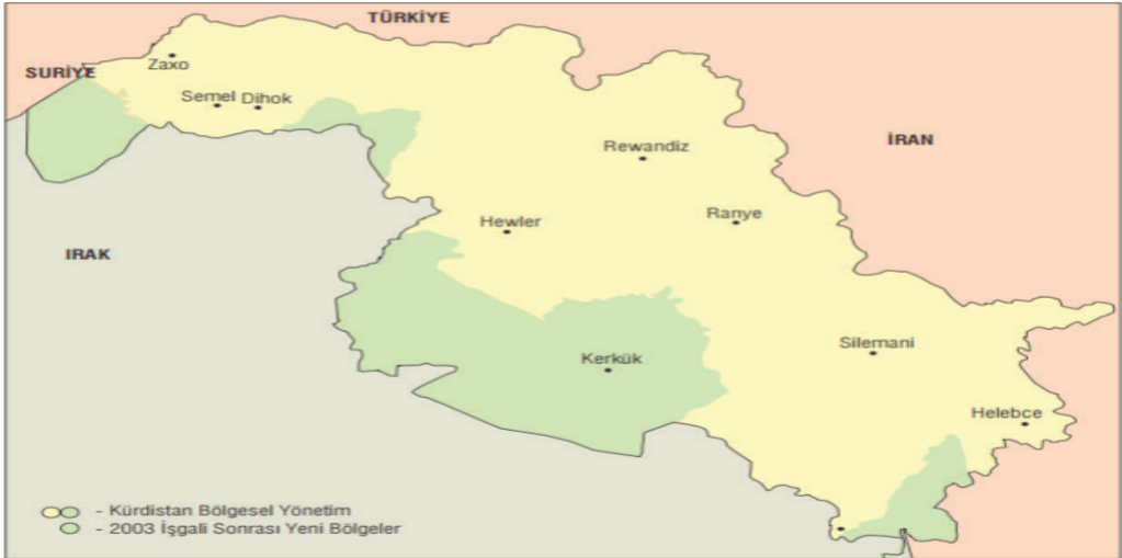
Harita 1: 2003 İşgalinin Ardından Kürt Bölgesel Yönetimi 2

Genel hatları ile 2000'li yıllarda Türkiye – Irak ilişkileri üzerinde etki sahibi en önemli unsur ABD'nin Irak'ı işgali ve takiben Saddam Hüseyin rejiminin sona ermesi olmuştur. Her ne kadar Soğuk Savaş sonrası önemde güvenlik algısı değişse de ve 2002 yılında Ak Parti hükümeti ile beraber farklı bir dış politika çizgisinde geleneksel güvenlik politikaları insani politikalara çerçevesinde yumuşak güç unsurları ile şekillendirilmek istense de, Irak özelinde bu politikaları uygulamak kolay olamamıştır. Irak'ın iç dinamikleri mercek altına alındığında bu durumdan Kuzey Irak Kürtleri büyük ölçüde nemalanmıştır. İşgal sonrası yeniden yapılandırma sürecinde Kürtler ülke sınırları içerisinde ellerini büyük ölçüde güçlendirmişler ve özerk konumlarını ve topraklarını genişletme şansı elde etmişlerdir. İşgal sırasında ABD askerleri ile işbirliği içinde Kürt peşmergeler Kerkük ve Musul'a ilerleyerek Irak işgalinin arkasında yatan en önemli neden olan petrol yatakları hakimiyetini kazanmak için ABD askerinin işini kolaylaştırmışlardır. (Oran, 2013: 410).